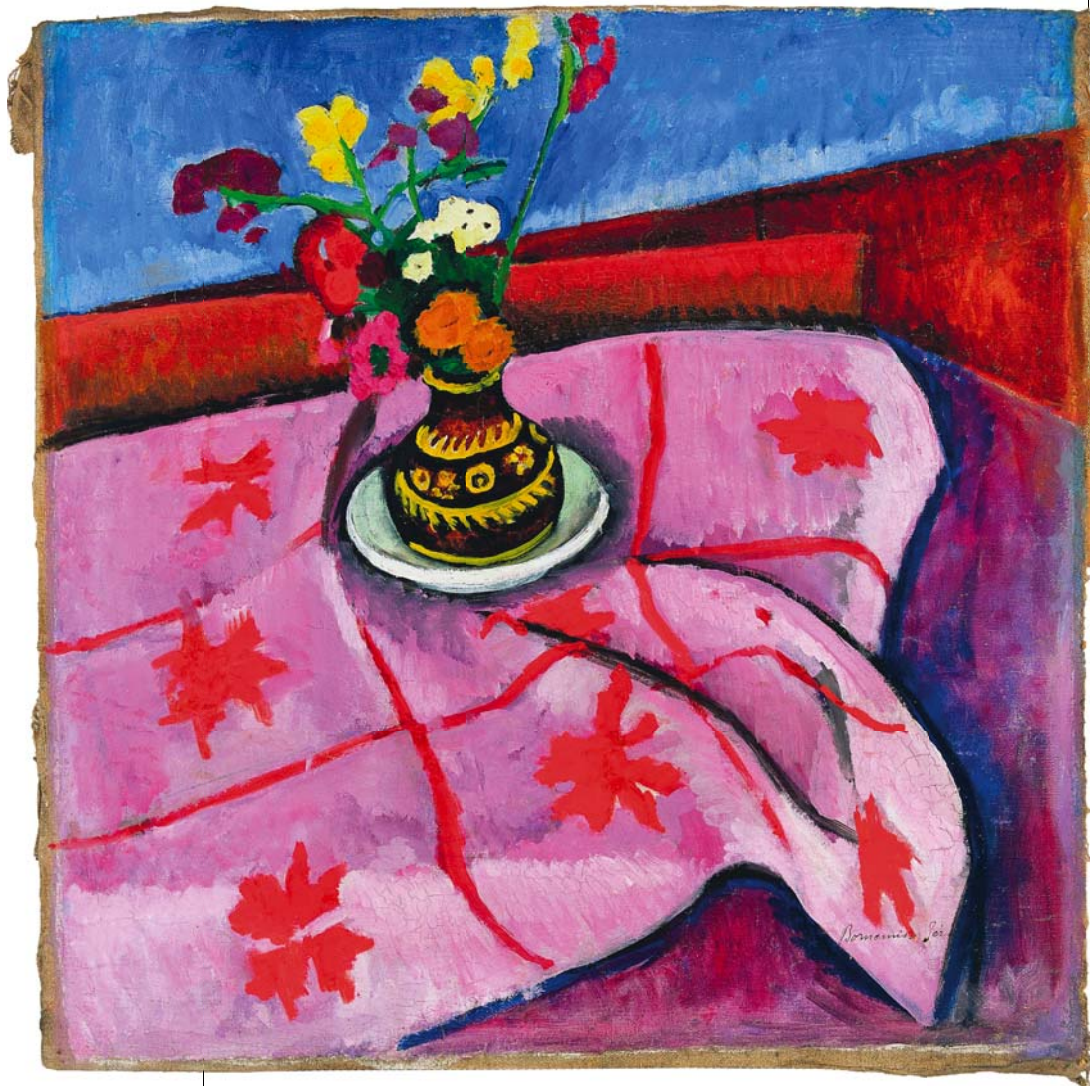
BORNEMISZA GÉZA: Virágcsendélet, 1910 k., olaj, vászon, 57,5x57,5 cm HUNGART © 2017

E mostani kiállítás ennek a szervezetségnek és szuverenitásnak állít emléket. Mert lehet, hogy mindez hamarosan emlék lesz csupán, mert a városi vezetés újabb intézkedései (egy, a múzeum eddigi ethoszával szembe forduló, annak eredményeit önhitt módon fitymáló „szakmai tanácsadó” kinevezése, a „közönség becsábítása” címszó alatt a dilettantizmust agresszív tással megfejező, „színes-szagos” kiállítások promotálása) nem sok jót ígér. Egyelőre csak reménykedni tudunk, hogy ezúttal még nem a temetésen jártunk, és hogy ez a szűk látókörű, saját értékeit semmibe vevő döntéssorozat nem teszi véglegesen tönkre fél évszázad munkáját.