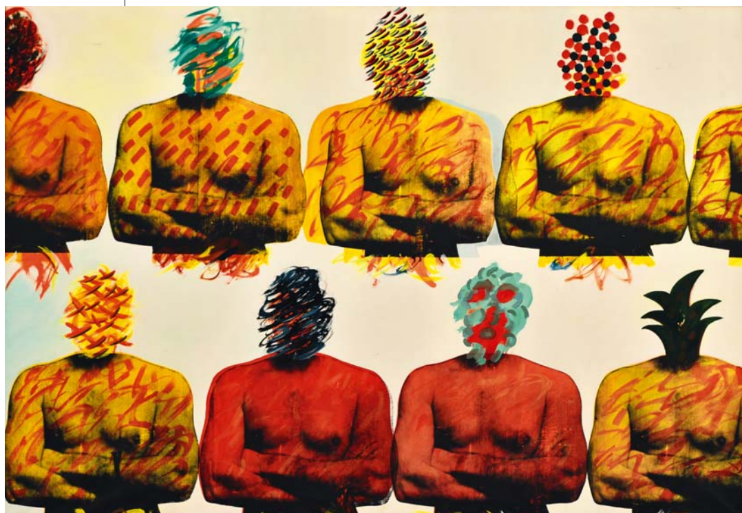
PINCZEHELYI SÁNDOR: Színház, 1978, olaj, vászon, 124x200 cm HUNGART © 2017