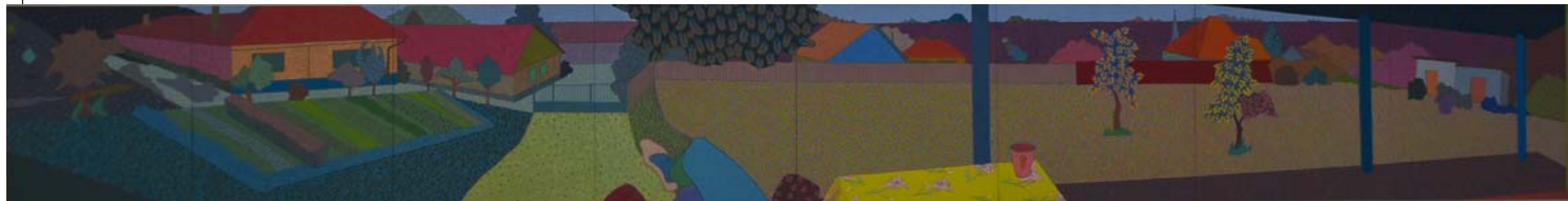
RADÁK ESZTER: Esztai körkép, 2003, olaj, farost, 100x800 cm HUNGART © 2017

ismert művészeti helyszín lett. A szombat késő délelőtti megnyitókra immár számos érdeklődő érkezett Pestről és máshonnan is, kicsit hasonlóképp ahhoz, amikor a 70-es évektől távolabbról is Szolnokra jártak azok, akik a korszerű színházat szerették.