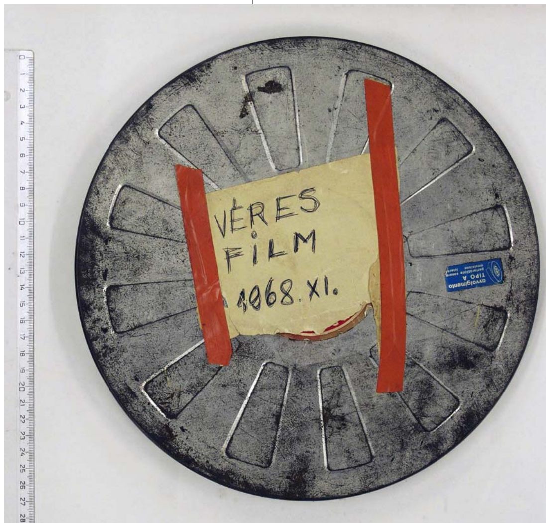
ST. AUBY TAMÁS: Véres film, 1968–2010, filmtekercs, tyúkvér, filmtekercstároló doboz, szigetelőszalag, papír, Ludwig Múzeum – Kortárs Művészeti Múzeum HUNGART © 2017

tosságukat, alapanyagaik megkopnak, meggyűrdnek. A múzeumi kiállítási gyakorlatban és a gyűjtésben ezek a problémák naponta újakkal szaporodnak, ahogyan a fejlesztők és a művészek friss technológiákkal állnak elő.