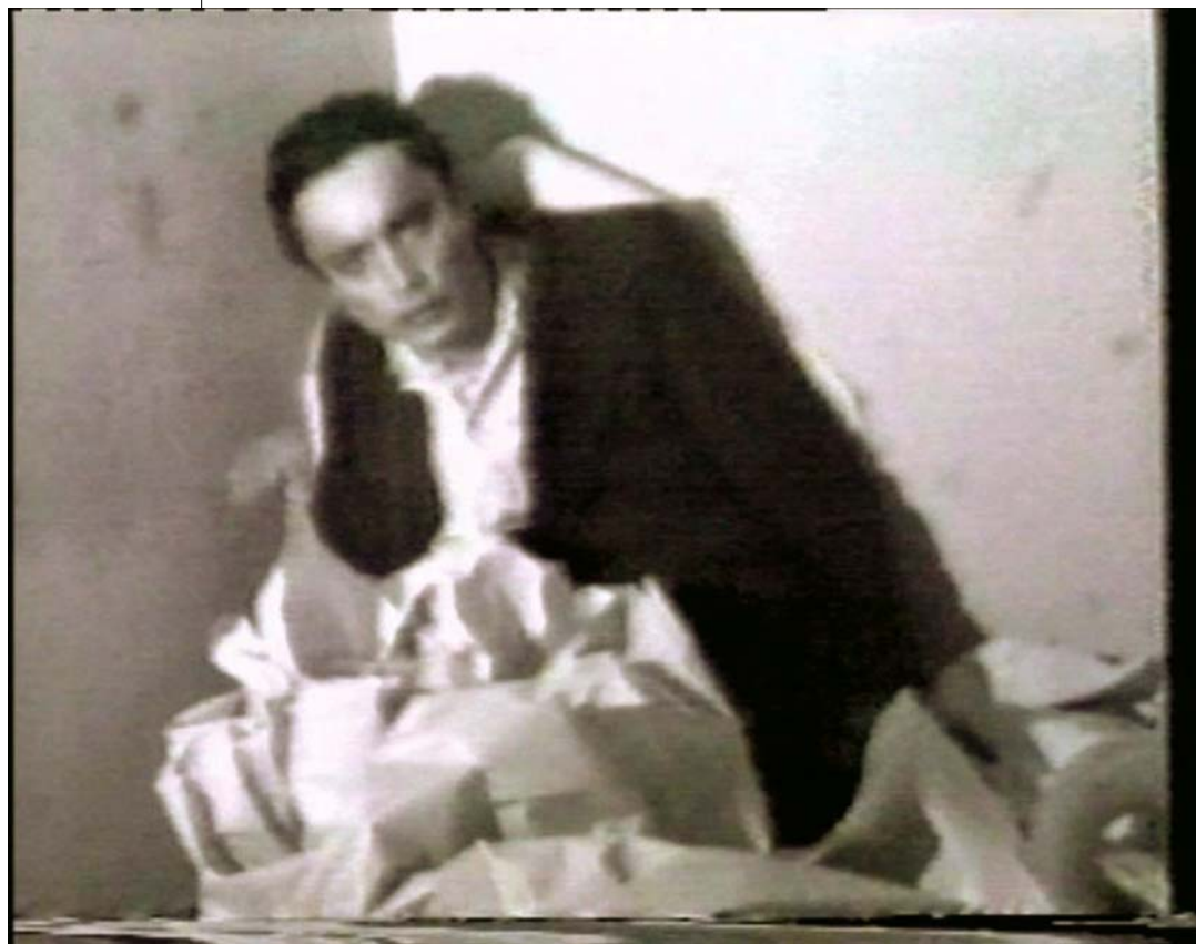
TÓT ENDRE: TÓTALJOYS, 1975–1976, videó, Ludwig Múzeum – Kortárs Művészeti Múzeum