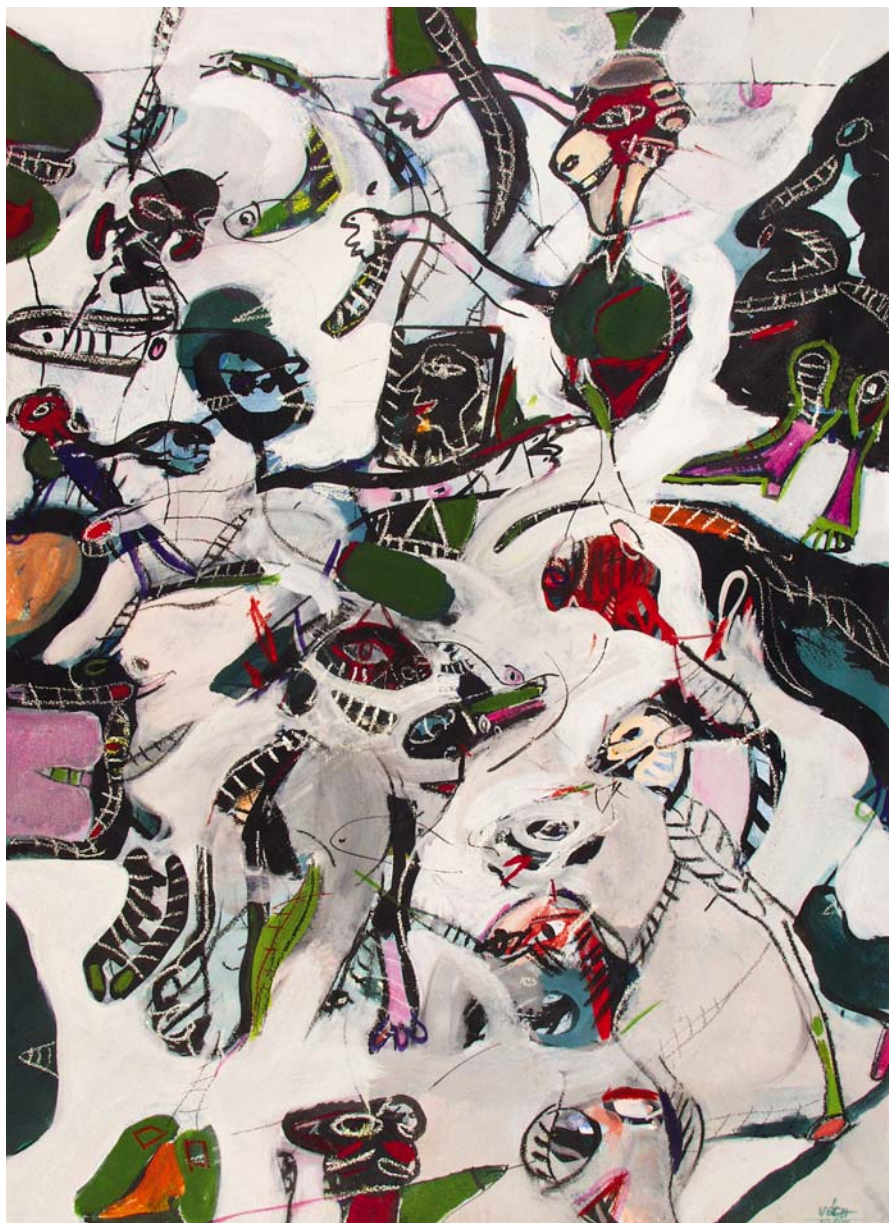
SZILY GÉZA : (Az I. Országos Akvarell Triennálé nagydíjasa, 2009) Tolnai kert oszlopai, 2000, papír, akvarell, pác, 47x69 cm