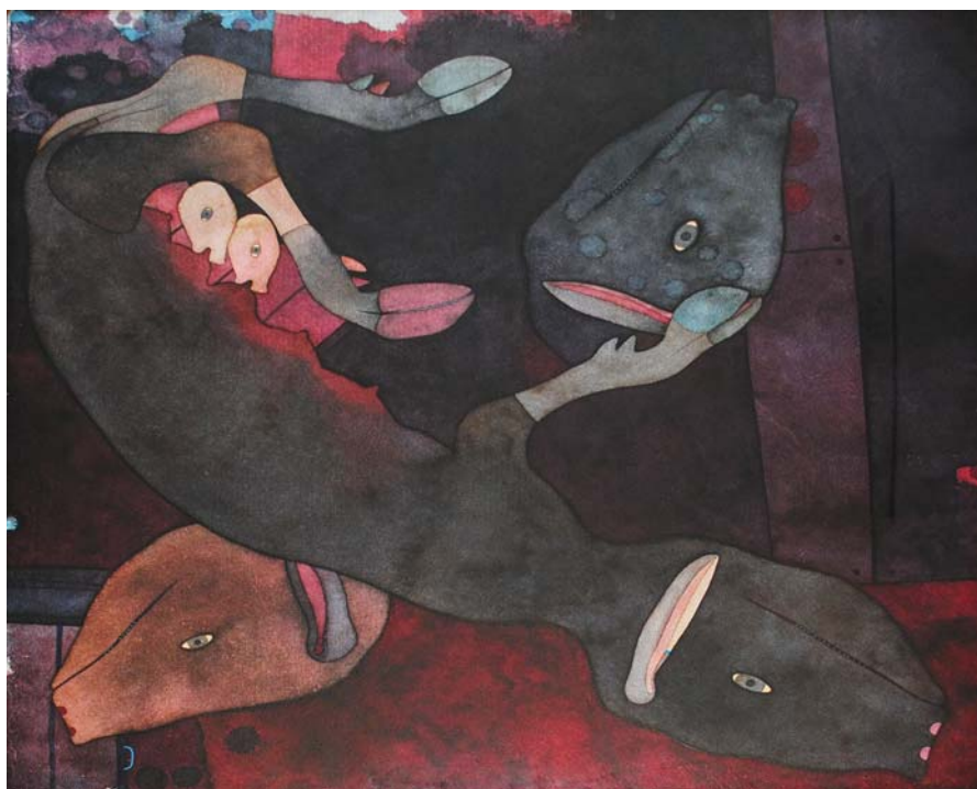
FÖLDI PÉTER: Disznóól, 2014, papír, vizes pác, 100x100 cm

táblaképek, valamint a – csak mellékesen említve, a szintén vizes eljárású – falfestészet »szolgáló leányaként« tartották számon... alárendelt funkciójából, egy célt csupán kiszolgáló mulandóságából e műfaj az egyedi rajzhoz hasonlóan, lépésről lépésre szabadult fel, hogy – Heribert Hutter szerint – »autonóm, önmagáért való műalkotás legyen, amely önértékénél fogva joggal igényelheti a maradandóságot, a gyűjteményekben való elhelyezését.« 1