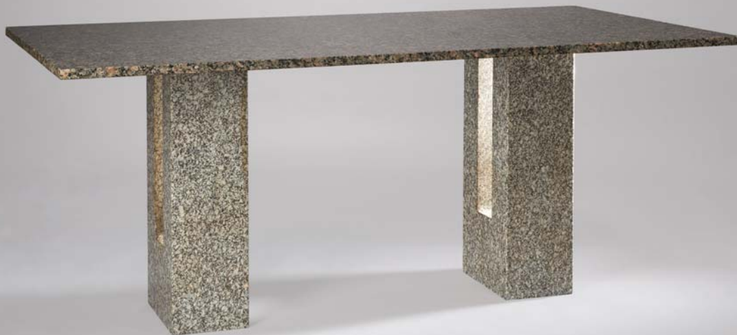
Gránit asztal, tervező: BRUEUR MARCELL , 1954/1965, Magyar Nemzeti Bank – Iparművészeti Múzeum HUNGART © 2017

A kis méretű díszterembe került Breuer gránitasztala, fali tablón néhány épületének fotója, életútjának vázlatos felidézése, mellettük a csőbútorok vagy a Francesca lányáról elnevezett Cesca-székek későbbi replikái, különböző kárpitozásokkal. Az eredeti prototípus B32 megnevezéssel 1928-ban készült, akárcsak a híres B3 karosszék, ami évtizedekkel később kapta a Vaszilij nevet. A régi tervek, modellek alapján Breuer legtöbb csőbútorát különböző cégek a mai napig gyártják, akár az interneten is megrendelhetők. Önálló tablót kapott a Delfi asztal , amelynek eredeti modelljét 1930-ban készítette Breuer. Az olasz építész, Carlo Scarpa áttervezte, Breuerrel együttműködve, előbb carrarai fehérmárványból, majd más variációkban. A Delfi asztal kiemelése teljesen indokolt, hiszen nagy hasonlóságot tart a most vásárolt, hangvilla lábú gránitasztallal. Néhány fotó felidézi a Delfi legújabb változatait, melynek lapja kristályüveg, és Scarpa fia, Tobia Scarpa tervezte 2009-ben, több változatban. Breuer ebben már nem működhetett közre, mivel 1981-ben elhunyt.