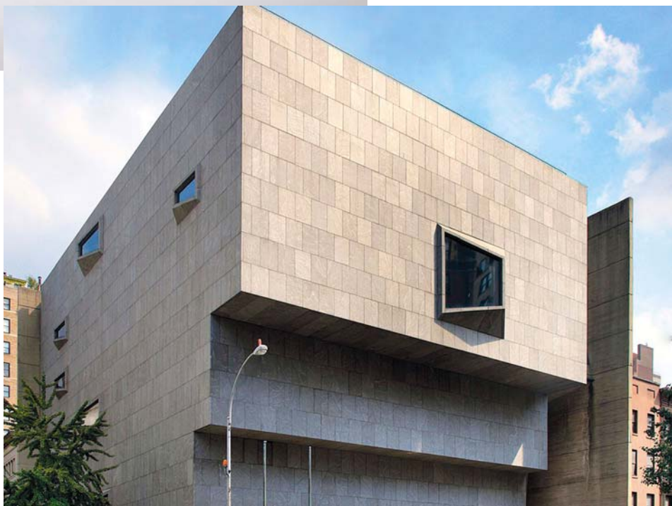
A régi Whitney Múzeum, New York

alig lehet felismerni lépcsőzetesen előrelépő homlokzatát. Időközben még a neve is megváltozott a közismert Breuer-épületnek. A Met, a Metropolitan Múzeum modern gyűjteményét költöztették át az épületbe, és mai megnevezése: Met Breuer. (Az új Whitney Múzeum nem költözött ki New York Manhattan negyedéből, de messzebb kapott egy nagyobb épületet. Az új múzeumépület homlokzatának egy része lépcsőzetesen hátralép.