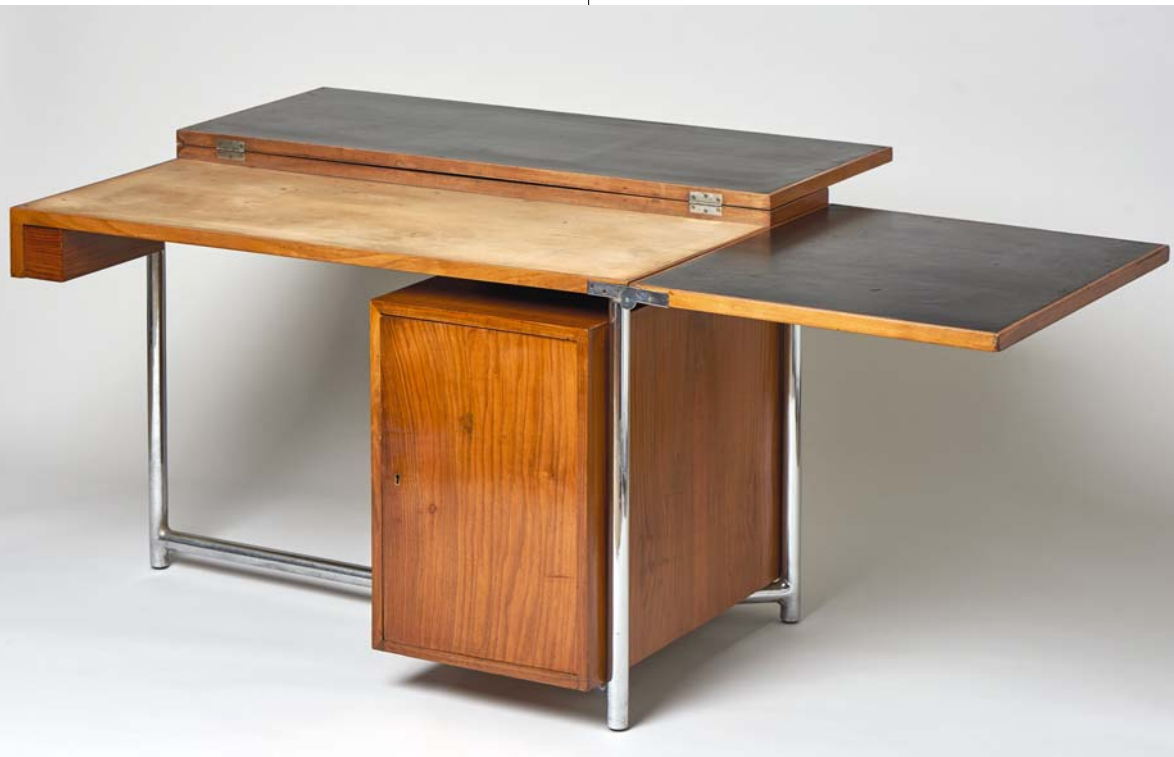
Íróasztal, tervező: KOZMA LAJOS, kivitelező: Thonet (?), 1930 k. Iparművészeti Múzeum

keletiesé. A Bauhaus letisztult funkcionalizmusa homlokegyenest szembe megy Lechner ornamentikus építészetével. A kiállítás tervezői molinókkal és leplekkel igyekeztek semlegesíteni a szecessziós környezetet, de Lechner erős mester, modora elnyomhatatlanul előtör. Átvérzik a kötés, ahogyan Pilinszky mondaná.