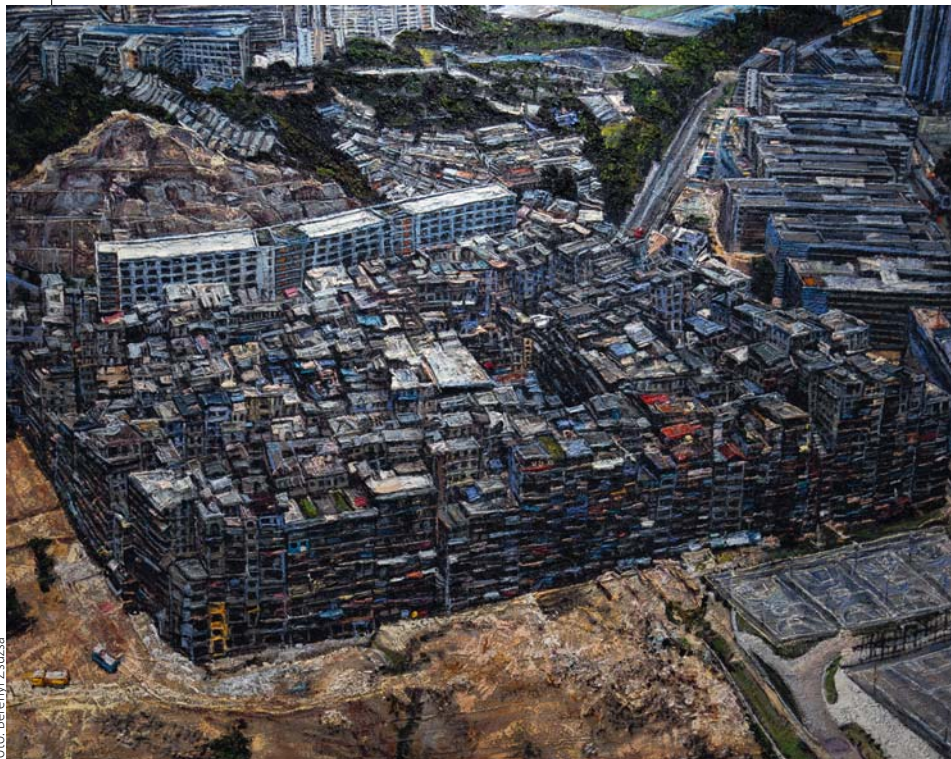
BARANYAI LEVENTE: Szodoma Hongkongban, 2016, olaj, vásznon, 146x201 cm