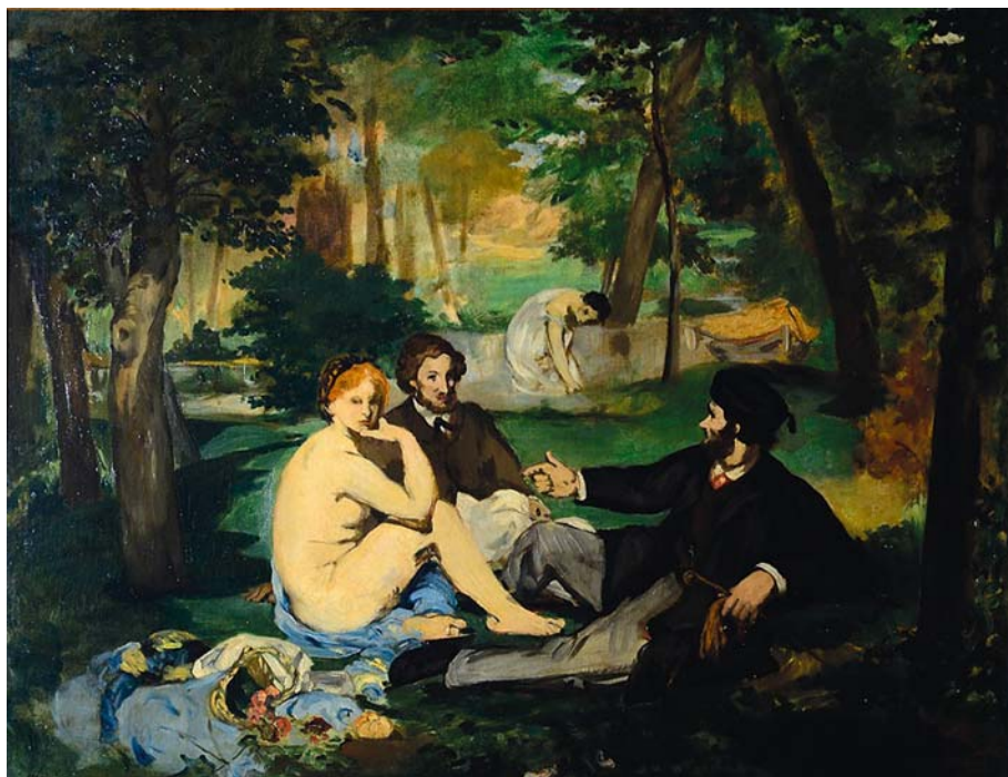
ÉDOUARD MANET: Reggeli a szabadban (Courtauld), olaj, vászon, 89,5 x 116,5 cm