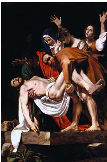
CARAVAGGIO: Krisztus sírba tétele, 1603–1604, olaj, vászon, 300x203 cm