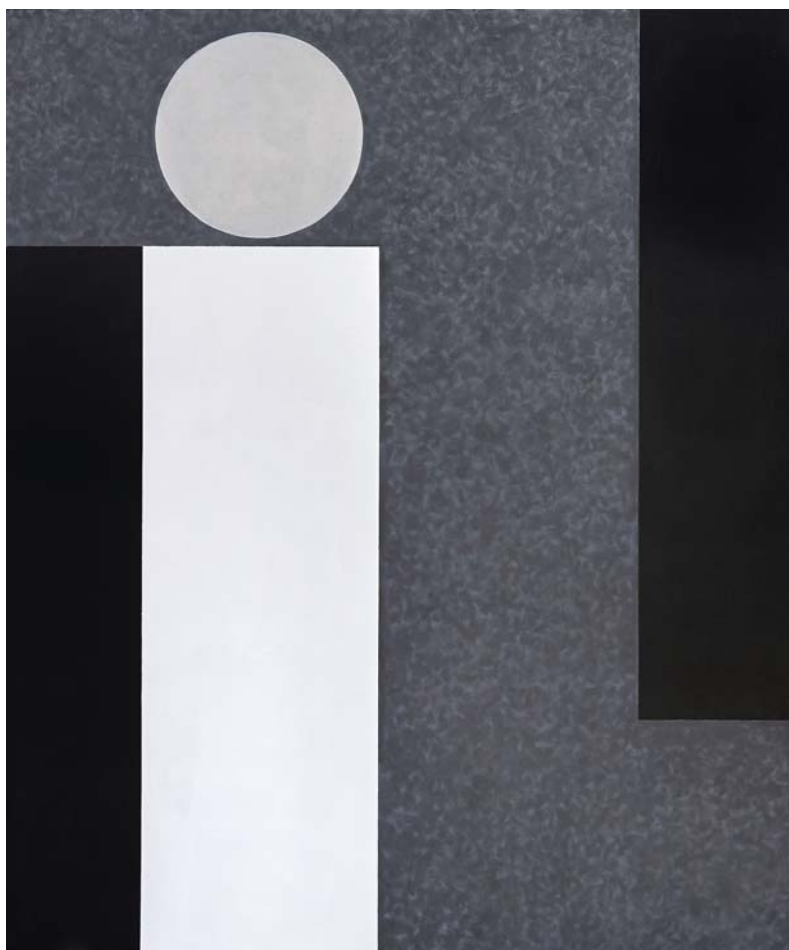
EÖRY EMIL: IZÉ, 2016, akril, vászon, 120x100 cm

„1940-től 1944-ig a városrész hajdani Szapáry-kastélyában működött a KALOT Népfőiskola képzőművészeti műhelye Illésy Péter vezetésével, és itt élt és dolgozott Szepes Gyula (1902–1992) festőművész, aki itáliai és párizsi tartózkodását követően, 1960-tól impresszionista hangulatú képeivel és szakkörének növendékeivel megalapozta a helyi művészeti élet folytonosságát”.