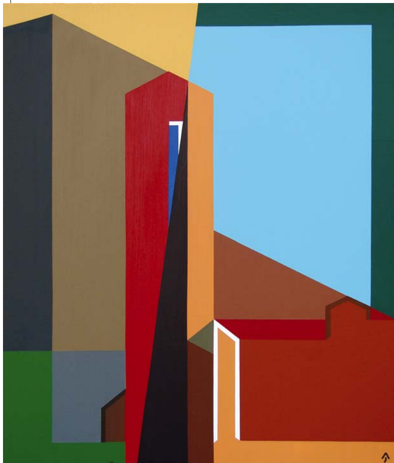
AKNAY JÁNOS: Emlék, 2016, akril, vászon, 120x100 cm