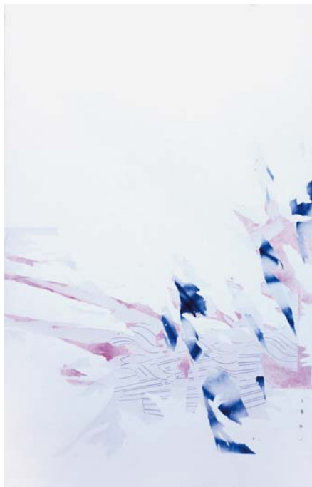
SZENTESI CSABA munkája

A Trafó Galériában megrendezett csoportos kiállítás a fiatal magyar művészet egyik potenciális nagy narratívájaként kínálkozó új absztrakt jelenségekre koncentrált, és annak tendenciáiban megfigyelhető párhuzamosságokra hívja fel a figyelmet.