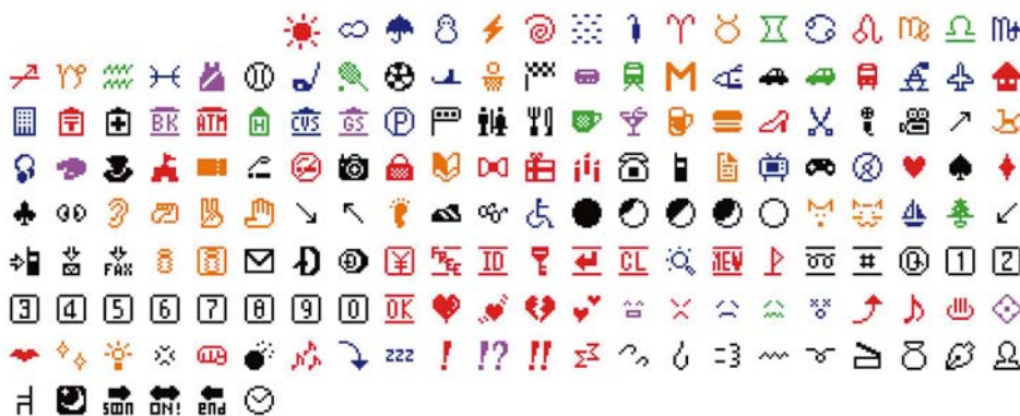
Az eredeti, az NTT DOCOMO által létrehozott 176 hangulatjel

A New York-i Museum of Modern Art bejelentette, hogy az eredetileg 1999-ben az NTT DOCOMO cég által létrehozott emóciós ikonok bekerülnek a múzeum gyűjteményébe. Az intézmény építészeti és designrészlegéért felelős Paul Galloway azzal indokolta a döntést, hogy ezek az eredetileg mobiltelefonokhoz tervezett „szerény mesterművek” a globális digitális kommunikáció egy új korszakának szimbólumainak tekinthetők, ezért kaphatnak helyet egy ilyen jelentős múzeumban. A MoMA már korábban is tett hasonló lépéseket, 2010-ben már szert tett a @-szimbólumra.