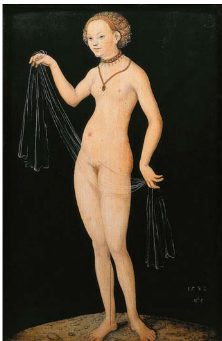
LUCAS CRANACH: Vénusz, 1532