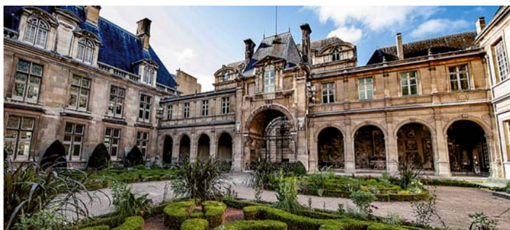
A Musée Carnavalet épülete Párizsban