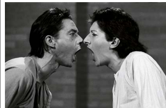
MARINA ABRAMOVIĆ és ULAY közös, Moving Time című performansza ('AAA-AAA', 1978) © HUNGART 2016

A művészvilág egyik legismertebb szerelmespárjának története új fordulatot vett. Marina Abramović és az ugyancsak performansművész Ulay (Uwe Laysiepen) szerelme akkor került ismét az érdeklődés középpontjába, amikor Abramović 2010-es, a MoMA-ban megrendezett retrospektív kiállítását kísérő performansz során a két művész 22 év elteltével újra találkozott egymással. A kibékülés viszont elmaradt, hiszen nem sokkal később Ulay szerződészegés vádjával pert indított a művésznő ellen, amelyet azzal indokolt, hogy Abramović visszatartja a közös alkotásaikból származó bevétel rá eső részét. A pereskedésből végül Ulay jött ki győztesen, a bíróság nemrégiben minden pontban az ő álláspontját fogadta el, így Abramovićnak a továbbiakban jelentős kártérítést kell fizetnie.