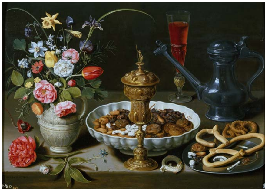
CLARA PEETERS: Csendélet virágokkal, 1611

Az 1940-es évek Vermeer-hamisításához mérhető botrány lehet kialakulóban, ha a nemrégiben a francia bíróság által elrendelt, 25 világhírű képet érintő eredetiségvizsgálatot követően bebizonyosodik, hogy a műalkotások hamisak. A vizsgálatban szereplő képek teljes listája egyelőre nem publikus, az azonban már nyilvánosságra került, hogy Frans Hals nak, Orazio Gentileschine nek és Lucas Cranach nak tulajdonított művek is gyanúba kerültek. Az egyik leghíresebb ilyen kép Cranach Vénusz című műve, amely 2013-ban 6 millió fontért cserélt gazdát, és amely korábban egy neves londoni galéria tulajdonát képezte.