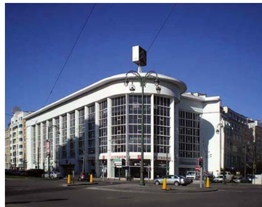
A Citroën volt székházának épülete

A Pompidou Központ és Brüsszel városa aláírták a megállapodást egy új, kortárs képzőművészeti múzeum létrehozására. Az új intézménynek már a helyét is nyilvánosságra hozták: a Brüsszel belvárosban található Citroën volt székházában kap majd helyet, 16 ezer négyzetméteren. Serge Lasvignes és a brüsszeli tartomány elnöke, Rudi Vertvoort bejelentették, hogy előreláthatólag 2020-ra tervezik a nyitást. A kiállítandó műveket a közel 120 ezer darabbal rendelkező Pompidou fogja kölcsönbe adni az új intézménynek.