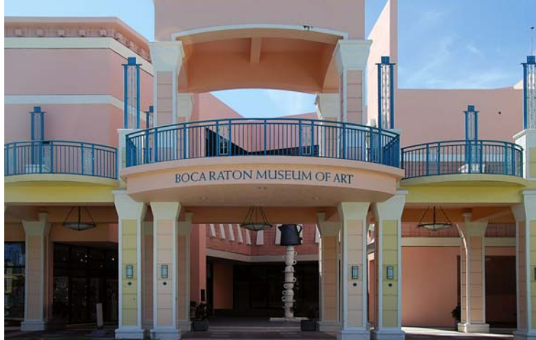
A Boca Raton Museum of Art épülete