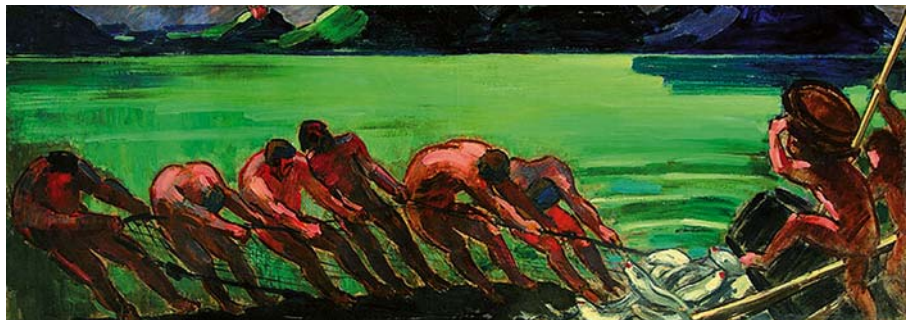
VASZARY JÁNOS: Halászat a Balatonon, 1926–28, olaj, vászon