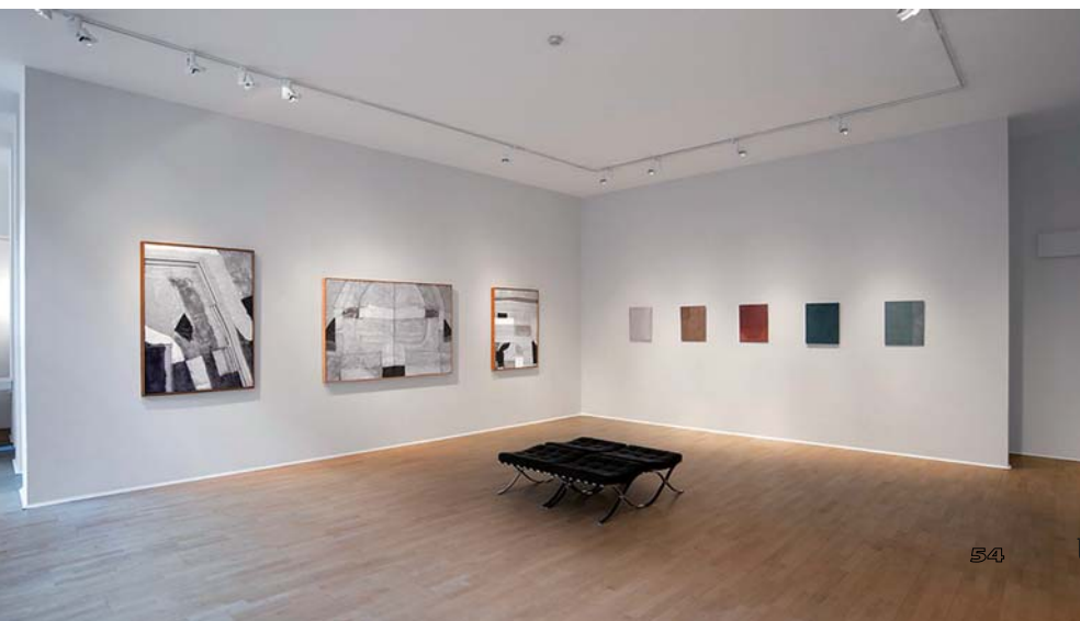
The Relief, from White to Black című kiállítás enteriőrképe