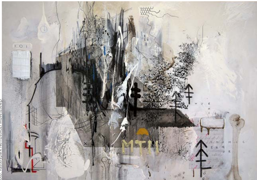
for: Kastélypark Nemzetközi Művésztelep

Benkő Lilla szürreális világa a mesék varázslatos vidékére viszi el a nézőjét, mágikus erdejében egy képzeletbeli bál fénypontjai rajzolják ki a Teleki kastély ovális barokk ablaknyílásait, az épület pedig mint meleg, sárga fény derengése jelenik meg a képén. A környezet, a vízfelület és a fenyves repetitív jelek az absztrahált ábrázoláson, amelyet a ráengedett csorgatás repít végérvényesen vissza a festészet alapvető kérdéseire. A metafizika és a szakrális-spirituális szférák áthatásának vizuális megfogalmazása köti le Dabóczy Gézát . Forrásai között Hamvas Béla írásai és az evangéliumok egyaránt megtalálhatóak. Grafikai műveiben mint egy alkimista transzformálja az anyagokat is. Egyetlen kiállított rajzában a bizonyos legendás