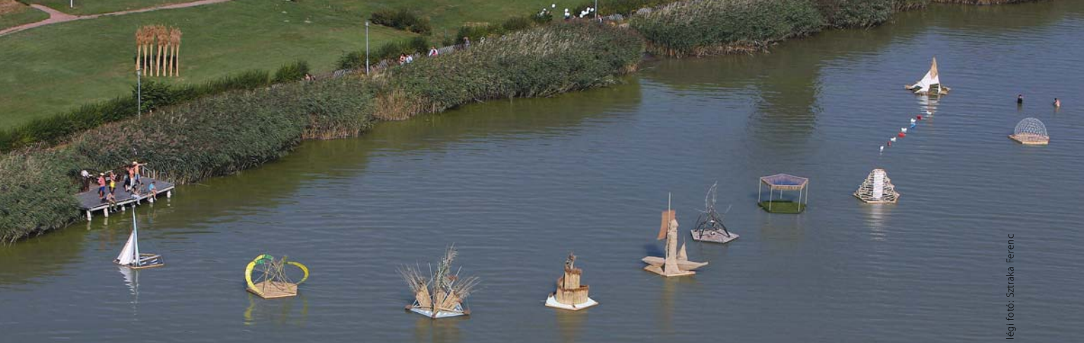
Fény fotó: Sztraka Ferenc

A vízén: BUDAHELYI TIBOR , BALÁZS PÉTER , PACZONA MÁRTA , HERENDI PÉTER , COLIN FOSTER , NIANA LIU-THORDAY FILOMÉNA , BIBOK PIROSKA , MÓDRA BETTINA-PALÁSTI KRISTÓF , SZIGETI CSONGOR , FREUND ÉVA munkái. Kacsák BURIÁN NORBERT munkái, a parton PÉTER ÁGNES installációja látható