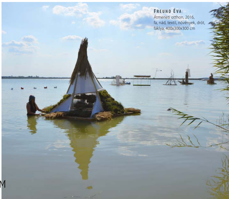
FREUND ÉVA: Átmeneti otthon, 2016, fa, nád, textil, növények, drót, fáklya, 400x300x300 cm