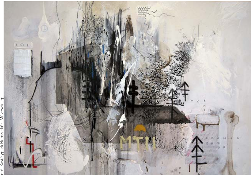
for: Kastélypark Nemzetközi Művésztelep