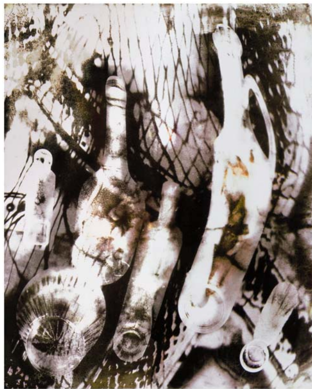
GÁBOR ENIKŐ: Részeg üvegek, 2001, fotogram