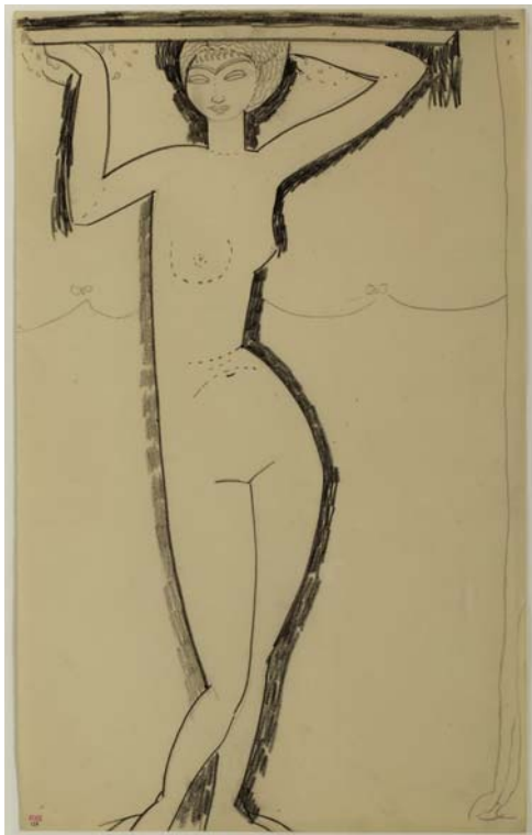
AMEDEO MODIGLIANI: Kariatida, előlnézet, 1914 előtt, kréta, papír, 427x263 mm magángyűjtemény, tartós letét

követ, vizet és tüzet használó performanszt komponált Modigliani, alakzatba rendezett szobrai köré megidézte a törzsi rítusok elementáris művészetét. Azt tartom a leginkább valószínűnek, hogy Modigliani azért hagyott fel a szobrászattal, mert az útja végére ért, elfogyott a szobrászi mondanivalója.