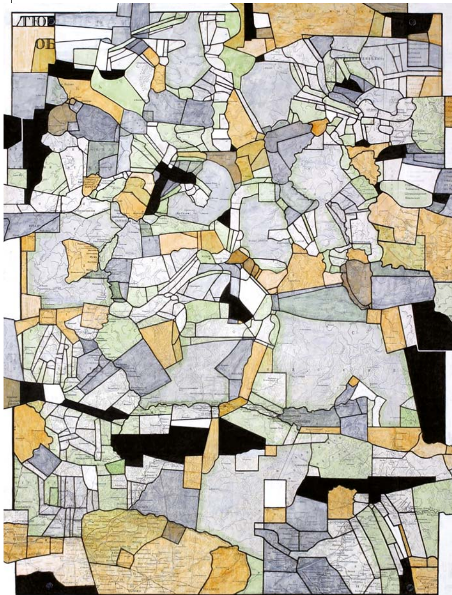
KOVÁCS ALBERT: Térkép, 2004, ragasztás, tus, akvarell, farost, 80x60 cm

Egy párizsi utamon jól megnézhettem a munkáit. Arra jöttem rá, hogy megfelel a célnak, ha a kollázs elemei mögé semleges, egyszínű vagy fekete hátteret adok. A másik felfedezés az volt, hogy az sem idegen a műfajtól, ha a kompozíciót vonalas szerkezetbe foglalom. Brezsnjev személye pedig adott volt az Übű-figura kiteljesedéséhez. Jarry szövegét a képzőművészet nyelvén legendásítottam tovább. Így keletkezett egy 50 darabból álló sorozat, amit először a rövid életű Helikon Galériában állítottam ki, azután másodszer a Francia Intézetben 1997-ben.