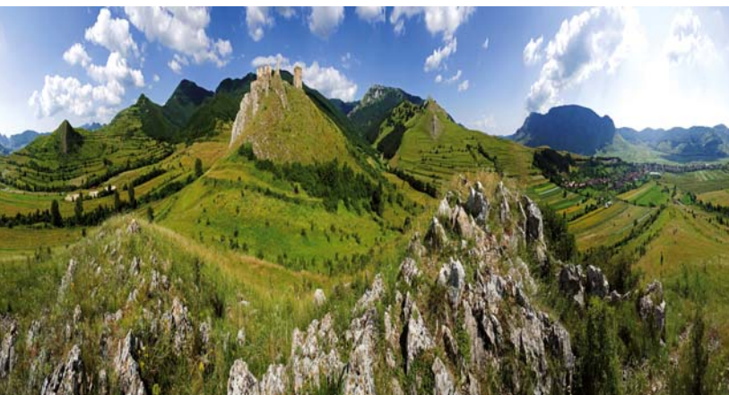
HARIS LÁSZLÓ: A torockószentgyörgyi vár, 2008

Negyvenöt éve annak, hogy egy gépészmérnök és egy állatkerti főápoló összebarátkozott. Egyikük fotózott, a másik festett, és mindketten abból a reménytelenül hazug, szürke világból próbálták magukat kiverekedni, amilyen a 60-as, 70-es évek Magyarországa volt akkor, s persze