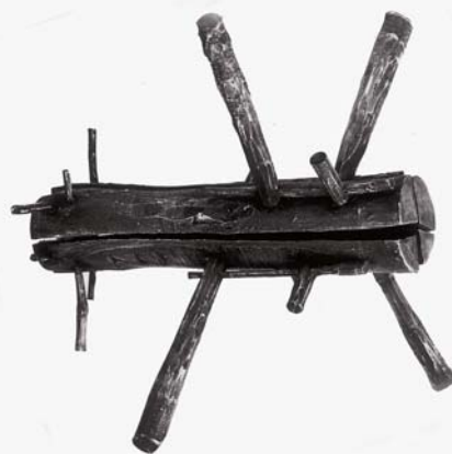
OROSZ PÉTER: Schmüle, 1980, fa, 79x73x73 cm

a stigma helyét tövissel jelölő Láb (1986–96), a barbár korokat idéző, sematikus Kapu (1990) vagy éppen a hengeres testű, háncssal körbetekert Fekvő torony (2000). A fűzött fészkekkel, bordákkal és csüngőkkel, Káin lábaival, tépett szárnyával, mankójával együtt ezek is mind-mind az életmű szerves részei, hiszen stílárisan, tematikailag és morfológiailag is könnyen kapcsolhatók a sorozat jellegű művekhez.