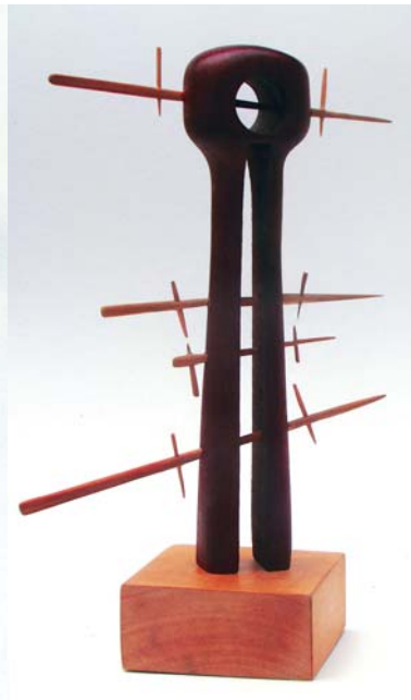
OROSZ PÉTER: Éden, 2010, vas, eperfa, eperfa háncs, 40x40x40 cm