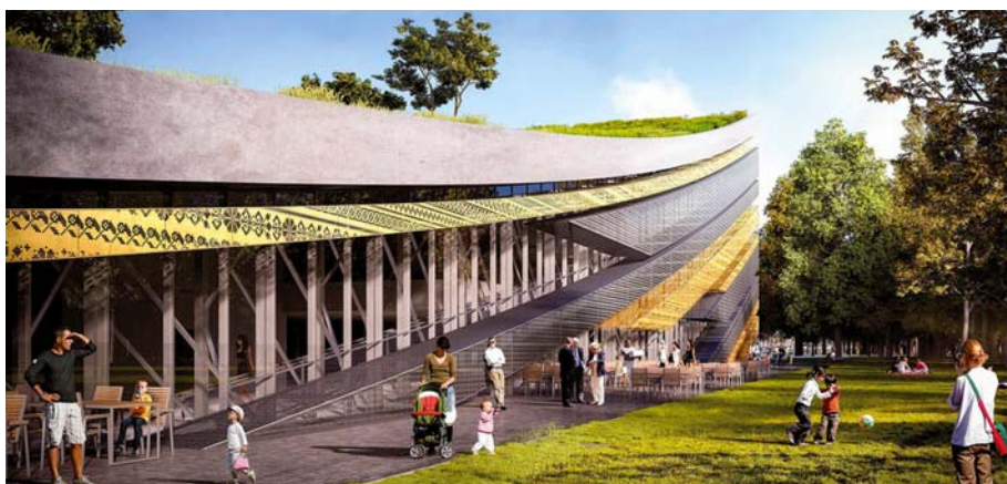
A Néprajzi Múzeum látványterve