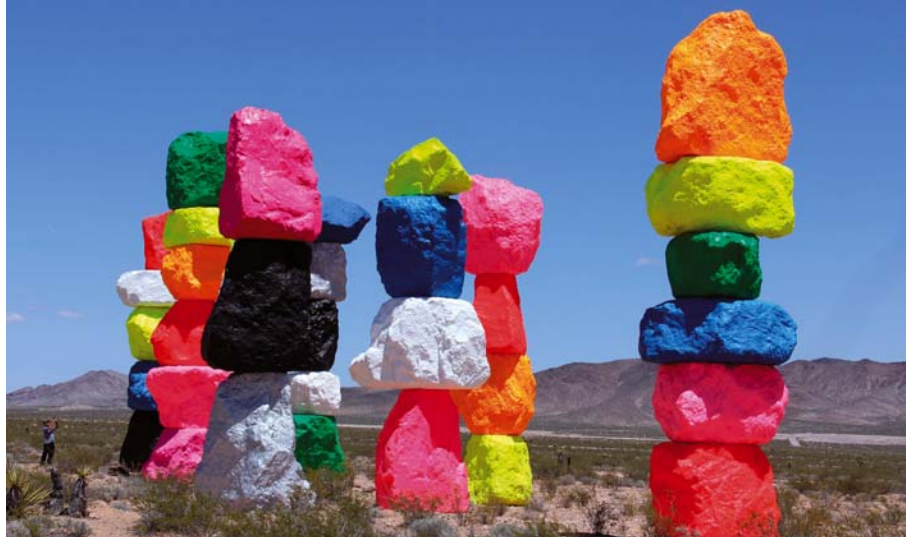
összeállította: Rudolf Anica