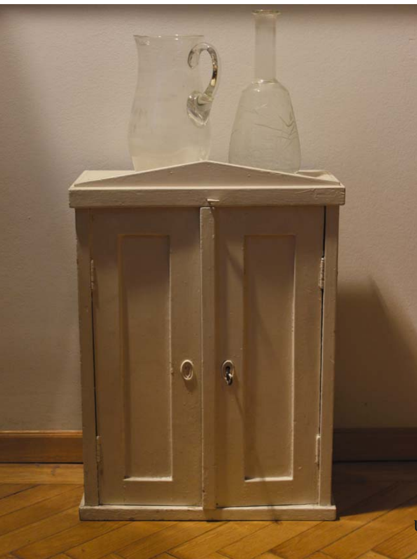
fotó: Jovánovics György

Jovánovics György művészetének a gerincét a 80-as évek elejétől az enyhén gyűrt felületbe mélyedő geometrikus alakzatokból álló reliefek, gipszlenyomatok alkotják. A korai fehér gipszdombor-