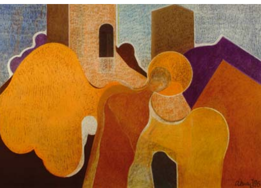
AKNAY JÁNOS: Városvédő angyal, 1976, olaj, pasztell, fa, 70x110 cm

Aknay János Kossuth- és Munkácsy-díjas festő-művész munkássága folytatása, egyben megújítása a több mint száz éves hagyománnyal rendelkező szentendrei festészet geometrikus törekvéseinek. Egyszerre jellemzi a barokk eredetű városka, „a festők városa” architektúrájának, sajátos motívumvilágának a hatása és a közvetlen vizuális környezettől való elvonatkoztatás szándéka, a képi szerkezet tömörítésének igénye, a geometrikus struktúrában a makrokozmosz törvényszerűségeinek a modellezése. Pozsonyi tárlata az életmű