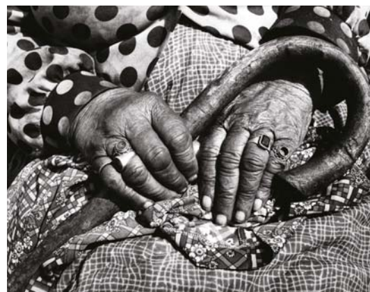
STALTER GYÖRGY: Csenyété , 1994

Önmagát frusztrált gyermekként mutató korai fotósorozatai, később készült polaroid aktjai, testképei, majd szociografikus, sokszor kegyetlen riportjai a sintérekéről, a kanálmanufaktúráról, a börtönök lakóiról s mindezek betetőzéseként a Horváth M. Judittal közösen készített Más Világ című könyvük a cigányokról... nos, ezek a látszólag nagyon különböző témák mind egy ember vállalt és vállalható alkotásai. Stalter szociálisan mindig érzékenyen reagált a körülötte élők, a tágabb világa dolgaira.