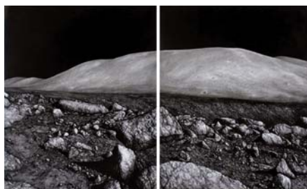
ISKI KOCSIS TIBOR: LUNA 4 , 2014, szén, papír, 170x280 cm

Az 1969-es sikeres holdraszállás egy máig ható, az emberiség legnagyobb tudományos eredményei közé sorolt teljesítmény, emellett a hidegháborús katonai szembenállás idején egy, az egész