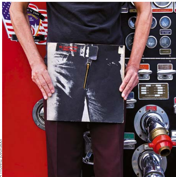
A művész ióvólából

Az Irwin, a legendás szlovén „művészkollektíva” tagjai Laibach néven vérprofi experimentális dark wave zenekart működtettek, amely többek között agyonjátszott popdalokat (pl. Life is life, Opus) alakított át wagneri nagyoperákkal vetekedő pátoszú, a mindenkori dikta-túrák hősi ellenállási zenedarabjaivá. A kiállításon most egy kisméretű önmanifesztáló táblakép képviseli a Laibachot, ironikusan a Beatles slágerének címével, a Let it be felirattal ellátva.