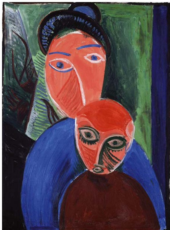
PABLO PICASSO: Anyja és gyermeke, 1907, olaj, vászon, 81x60 cm