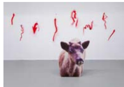
Maga az élet Moderna Museet, V. 8-ig