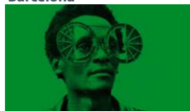
Megcsinálni Afrikát. Kortárs afrikai művészet CCCB, VIII. 28-ig