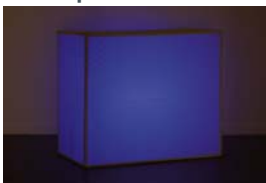
A rés. A belga absztrakció MUHKA, V. 29-ig