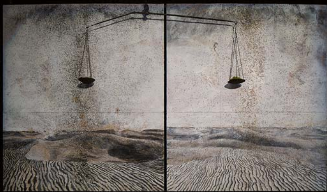
ANSELM KIEFER: Alkímia, 2012

Melankólia a második torony neve. Arról ismerhető fel, hogy a legfelső elem Albrecht Dürer 1514-ben készült rézkarcának poliéderét ábrázolja, ami valószínűleg a művész allegóriája. A reneszánsz filozófia ugyanis úgy tartja, hogy a művészek a „Szaturnusz jegyében születtek”, márpedig a Szaturnusz a melankólia bolygója, tehát meghatározza a művész kontemplatív, ambivalens habitusát. A torony aljában üvegszilánkok és papírszeletek, azaz a „hullócsillagok” jelképezik a jelenkort. Rajtuk az égitestek NASA által használt sorszámai olvashatók. Az Ararat a kis-ázsiai hegyről kapta nevét, ahol a Biblia szerint Noé hajója zátonyra futott. Ezt jelképezi a torony tetején az a kis ólomhajó, ami lehetne a béke és a menekülés hírnöke, de egyúttal egy pusztítást és elnéptelenedést okozó hadihajó is.