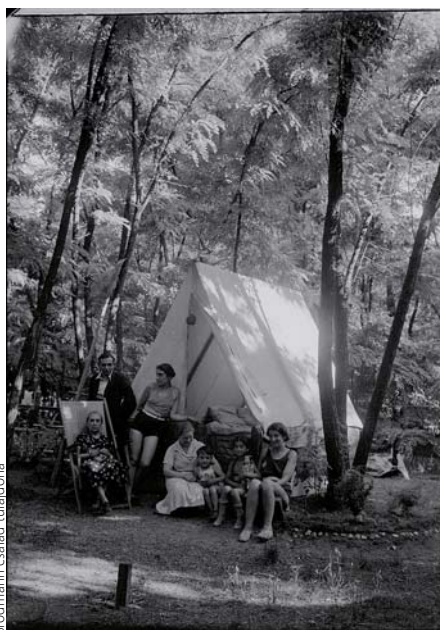
Brodmann család tulajdona

A Vízirí – Munkáskultúra a Duna partján című kiállítása a Természetbarátok Turista Egyesületének (TTE) és a Szentendrei-szigeten kialakított horányi táborhelynek a munkáskultúrában a két háború közötti időszakban betöltött szerepét vizsgálja. A kultúra fogalmán a jelentések, a hétköznapi és ünnepi gyakorlatok, valamint az anyagi kultúra