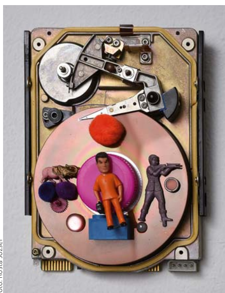
B.P. SZABÓ GYÖRGY: Cím nélkül, 2016, vegyes technika, 20x15 cm

Az Akkumulátor című csoportos kiállítás a mai művészet különböző területeinek képviselői közül olyan alkotókat mutat be, akiknek munkájában szerepet kap a gyűjtési tevékenységre való reflexió. A kiállítás egy jellegzetes művészi attitűdöt vesz nagytól alá, és ezzel a Budapest Galériában 2015-ben megrendezett Munka-művek című tárlatot gondolja tovább.