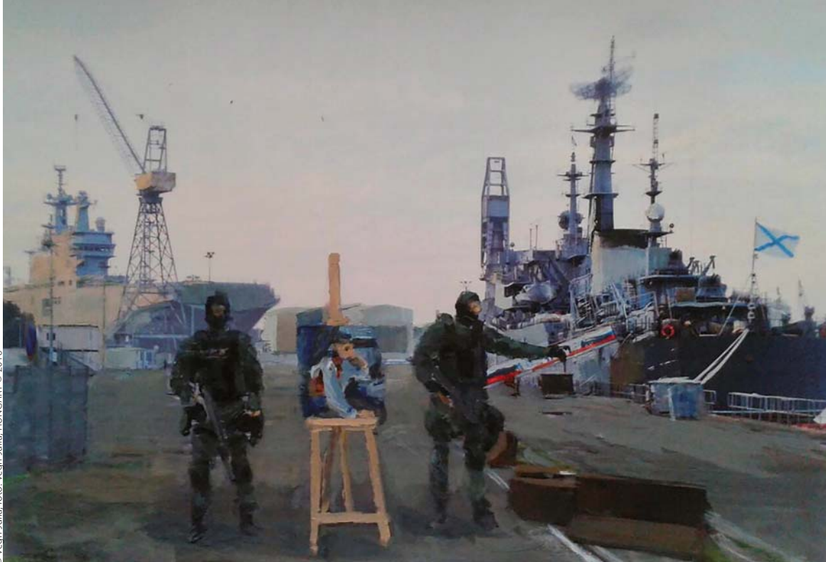
VÉGH JÚLIA: Aukció (A Valóság fikciója című sorozat része), 2014, akrilkollázs műanyag táblán, 20x30 cm