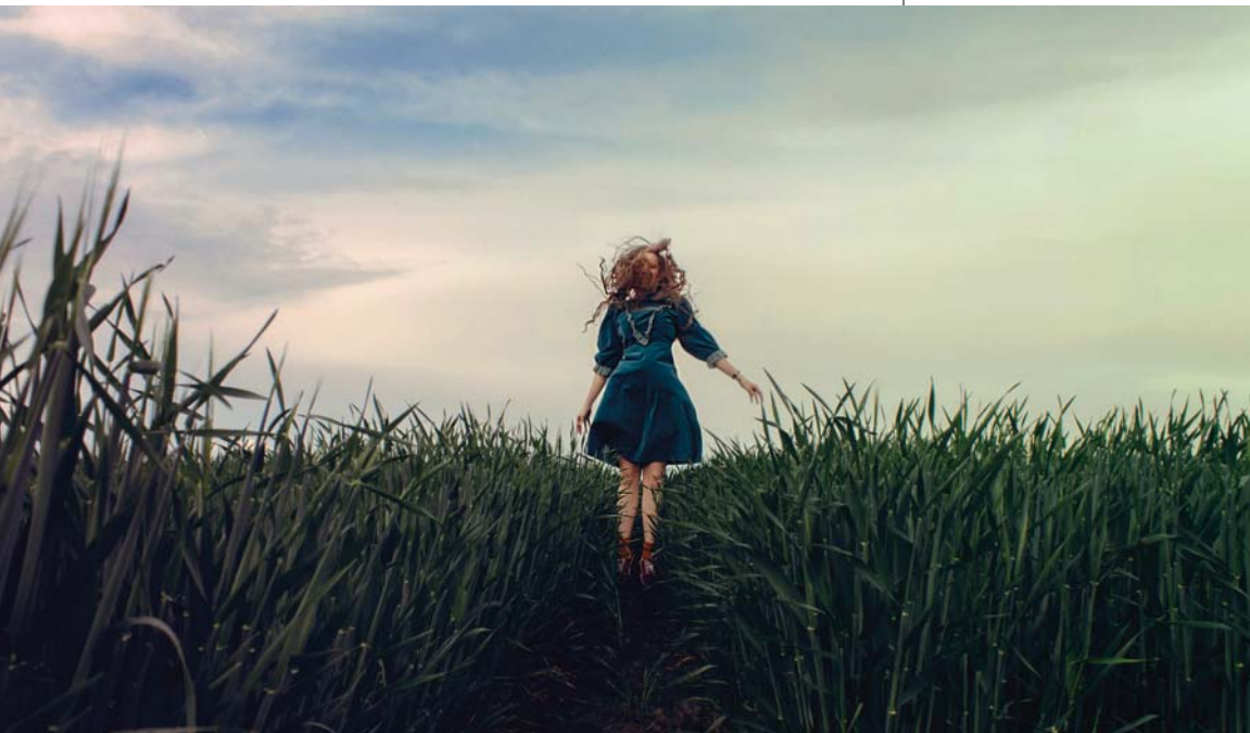
© Irina Ghenu, foto: Irina Ghenu, HUNGART © 2016

bauMax tulajdonosaként ismert – házaspár kezdeményezése már az induláskor igen nagy figyelmet keltett, hiszen nem egy, hanem egyszerre öt országban (Csehország, Horvátország, Magyarország, Szlovákia, Szlovénia) hirdették meg a pályázatot, amelynek országokénti nyertese négy-, második helyezette három ezer eurót kapott. A nyertesek – körvonalazódott a szisztéma már 2005-ben – a pályázaton részt vett tíz-tíz legjobb munkát kiállító hazai tárlat után ősszel Klosterneuburgban közös kiállításon vesznek részt, az anyagot angol és német nyelvű katalógusban is publikálják. A föltételezés szerint, aki ezen a pályázaton sikerrel szerepel, alighanem a nemzetközi közvélemény figyelmét is felkelti, annál