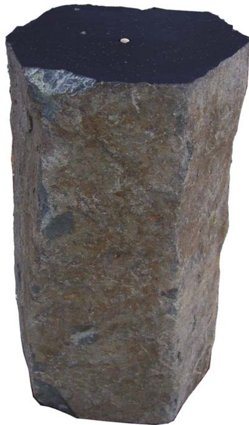
BALANYI ZOLTÁN: PNEUMA, 2016, bazalt, kvarckavics, 80x55x47 cm