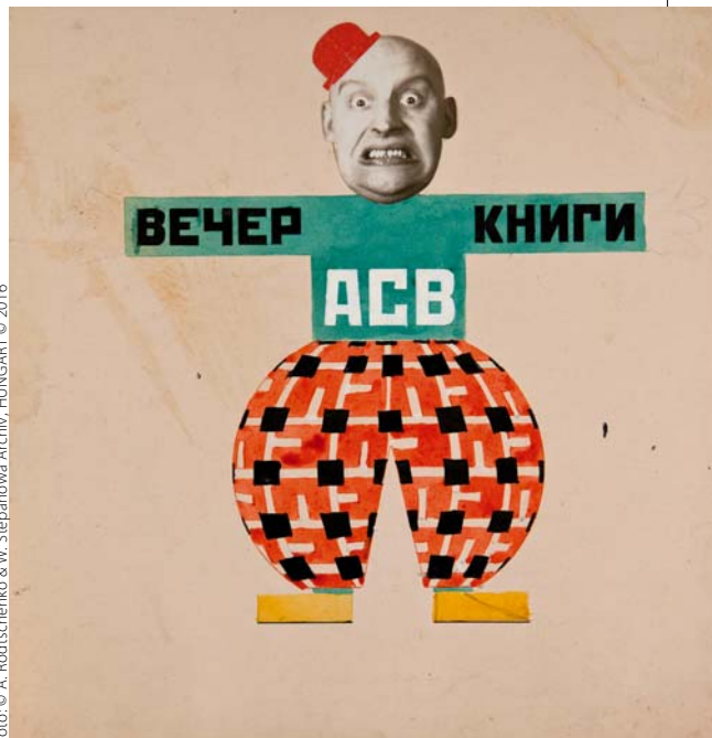
VARVARA SZTYEPANOVA: Rodcsenko-karikatúra, 1922, tusrajz, 23,5x18 cm, magántulajdon