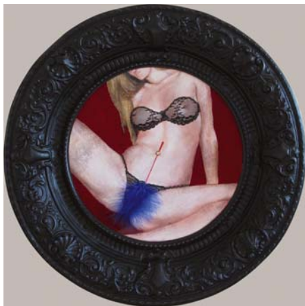
KARÁCSONYI LÁSZLÓ: Puhatollazás, 2015

A tárlaton fotósorozatok és videoinstallációkat láthatnak tőle a látogatók, melyek a természet, az ember és az épített környezet viszonyait, a technoszféra természetét járják körül. Kísérleteinek