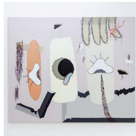
JAKUB HOŠEK: Let the fire burn low cause we like it that We let the ash flow down, 2015, akril, vászon, 150x125 cm

Hošek a fiatal prágai művészeti szcéna egyik legerősebb és legérdekesebb alakja, totális művész, aki egyszerre festő, zenei promóter és kiadó is. Számos felületes jelző ragadt rá az évek során a