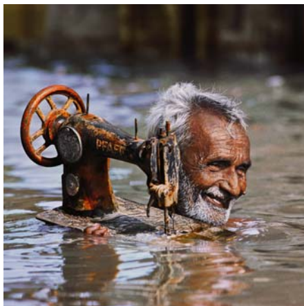
STEVE MCCURRY: Egy szabó varrógépet viszi a monszun idején, 1983, National Geographic, 1984/december

McCurry többéves szabadúszó tevékenység után egy hátizsáknyi ruhával és filmtekerccsel keresztül-kasul utazta Indiát, miközben fényképezőgépével fedezte fel az országot. Többhónapos utazás után lépte át a pakisztáni határt, ahol egy afgán menekültből álló csoporttal találkozott. Akkor