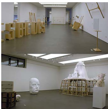
Részletek a kiállításból