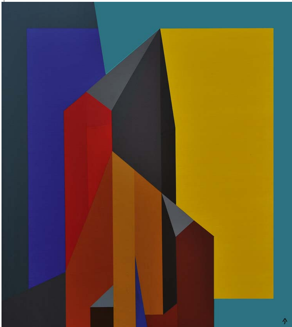
AKNAY JÁNOS: Emlék, észéki katedrális, 2015, vászon, akril, 100x90 cm