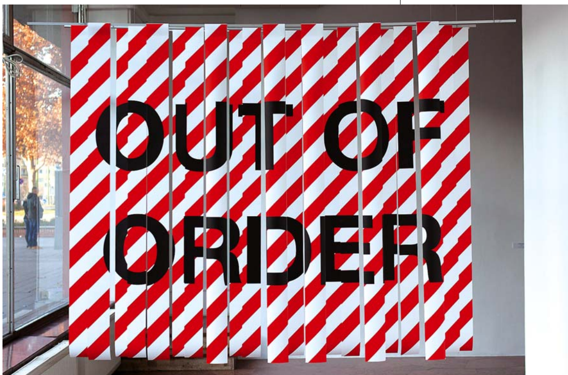
BENCZÜR EMESE: Out of order, 2010, műanyag szalagok

el fejébe a tudás. Mindeközben csakis úgy válhat művésszé, ha a gyermekét tartó két kezén túl növeszt még kettőt, melyekkel festeni tud, és még egy ötödiket, hogy jó feleségként ebédet kavargasson.