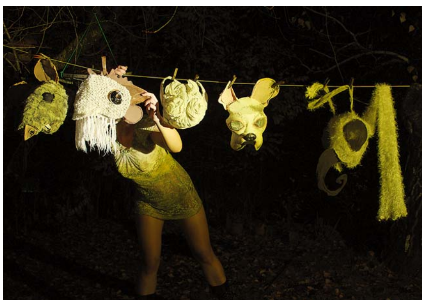
PÁHI-FEKETE NOÉMI: Metamorfózis – Kaméleon, 2014, giclée print, 54x75 cm, 47x65 cm, 54x75 cm