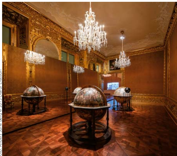
for: Anders Sune Berg © 2015 Olafur Eliasson

A fent említett hívószavak közül a fény elsősorban olyan terekben kap szerepet, amelyek távolabb esnek a sokat emlegetett tükörfaltól, ezek a, munkák rendszerint a mozgás, a test és a színek egymásra hatásával játszanak. A fény megmutató-elrejtő természetére épít a kinetikus – mondhatni pneumatikus – Kettős fényventillátor . A mű szerkezete rendkívül egyszerű, és lényegében a