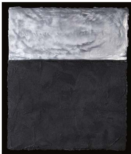
ZÁBORSZKY GÁBOR: Quo vadis? 2007

„Amikor hálót borítunk a világra, térben és időben mérföldköveket állítunk, az nem a világ, hanem a mi ügyünk. Valószínű, hogy ez a szubjektív lét is bír némi meghatározó erővel a világ irányába. Viszonyunk állandó adás és kapás, melyben mindketten változunk. Érdeklődésem strukturalista alapokról indult. A jellé válás lehetősége és az