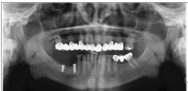
3. kép: Panoráma röntgenfelvétel

vül kiegyensúlyozottnak írta le, stresszkezelési metódusának a rendszeres testedzést, mozgást jelölte meg. Az állkapocsízület vizsgálata során a mandibula nyitáskor mozgáskorlátozottságot, oldalirányú eltérést, kóros hangjelenséget nem tapasztaltunk. Az önálló, teljes fájdalommentes aktív szájnyitási érték 45 mm volt. Protrúziós vagy laterotrúziós zavart nem észleltünk. A temporomandibularis ízület és a rágóizmok a tapintásos vizsgálat során nem voltak érzékenyek. A fogazat áttekintésekor az alsó fogakon erős fénylő fogkopások voltak észlelhetők (2. kép).