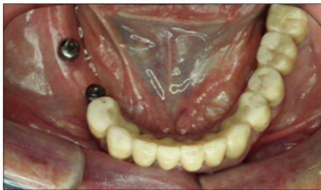
6. kép: Alsó állcsont ideiglenes pótlás, implantátumok ínyformázó csavarokkal

Mivel a páciensnek nincs cranimandibularis diszfunkciója, a fennálló alvási bruxizmus esetleges fogpótlásokat károsító hatásának elkerülése érdekében puha mélyhúzott 2 mm vastagságú sínt készítettünk éjjeli hordásra.