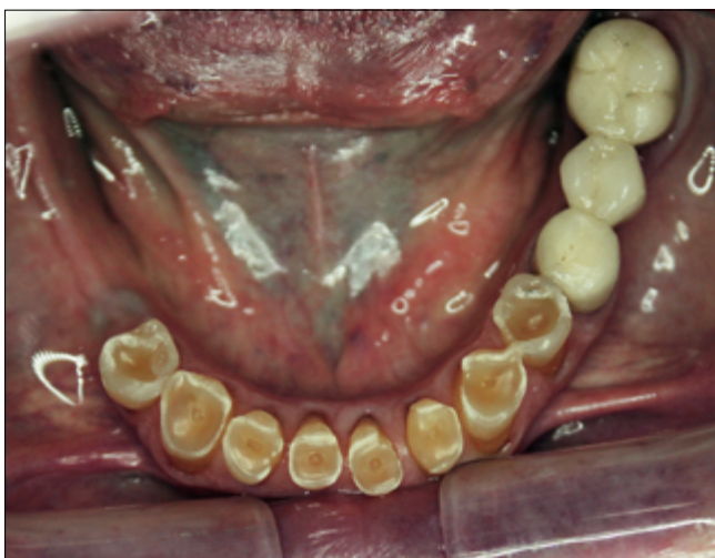
2. kép: Alsó állcsont kiindulási állapot