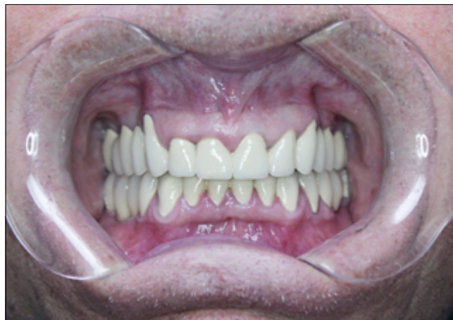
10. kép: Végleges pótlások, IKP helyzet