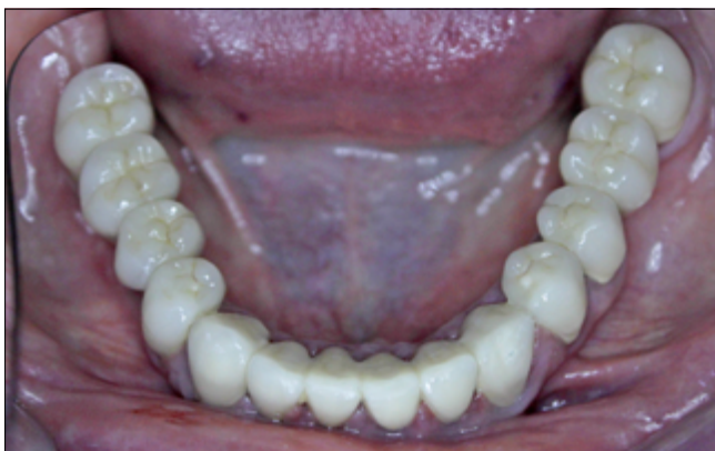
8. kép: Alsó állcsont végleges fogpótlás