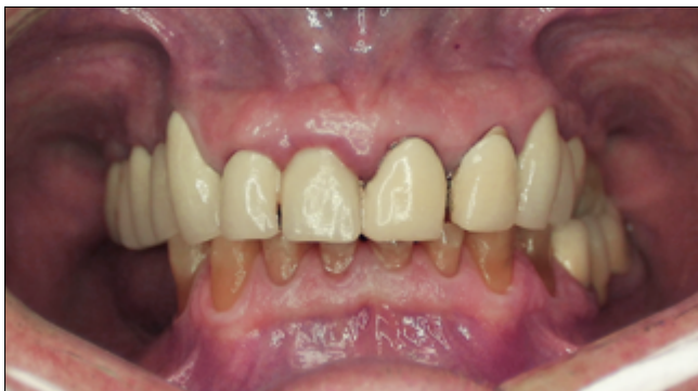
1. kép: Kiindulási IKP helyzet