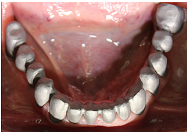
7. kép: Alsó állcsont fémváz próba szájban