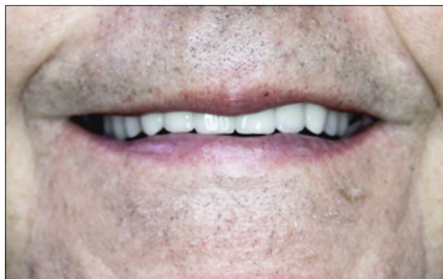
11. kép: Végleges pótlás, mosolyfotó