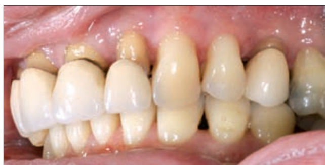
7c ábra. Szteroid terápia mellett stabil és fájdalommentes állapot tartható fent.

javult, majd a 7. napon a recidivált duzzanat teljesen eltűnt, sőt a gingiva epithelializálódott, betegünk fájdalmai pedig megszűntek (7a, 7b, 7c ábra).