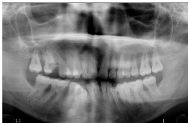
2. ábra. A 31 éves páciens radiológiai státusza

Szondázáskor minimális ínyvérzés tapasztaltunk, a BOP teszt 25% körül mozgott. Az előkészítő többszöri supra- és subgingivalis depurálás, valamint a páciens instruálása után, sebészi tasakredukció mellett döntöttünk, mert a fibrotikus ínytömeg konzervatív kezelést követő zsugorodására már nem volt remény. Helyi ér-