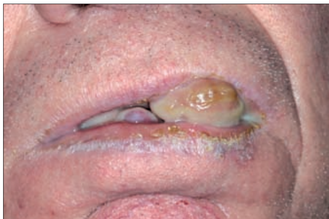
5a ábra. Az idős férfi páciens a hatalmas ínnyuzzanat miatt már ajkait sem tudja összezárni.

A 72 éves férfi páciens a SE Arc-Állcsont-Szájsebészeti és Fogászati Klinika ambulanciája utalta Klinikánkra. A beteg anamnézisében magas vérnyomás, szívritmuszavar, depresszió szerepelt, és több mint 10 éve kalciumcsatorna-blokkolót (Norvasc) szedett. Már extrorális vizsgálat során feltűnt a beteg szájából kinyúló ha-