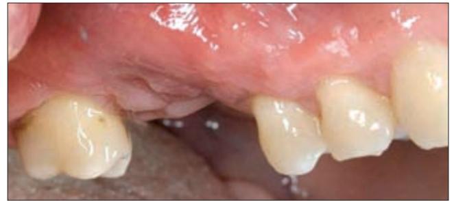
4c ábra. Gyógyuló jobb felső moláris régió, 16 fog extractiója után 3 héttel