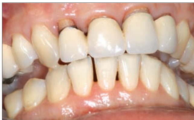
8a ábra. Egyéves kontroll-állapot, a szteroid kezelés mellett az inyduzzanat nem tért vissza.

A páciens későbbi, rendszeres ellenőrzése során további recidívát nem tapasztaltunk. Amikor a hematológus kolléga 16 mg alá próbálta csökkenteni a szteroid dózist, a páciens inyfájdalma visszatért, és az íny konzisztenciájában azonnal romlás következett be. Így, páciensünk, most már több mint egy éve, napi 16–32