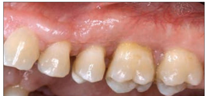
4d ábra. Bal felső moláris régió, 6 hónappal a műtétet követően

után a sikeres szájhigiénés programnak köszönhetően a folyamatos Cyclosporin terápia ellenére posztoperatív recidíva nem lépett fel, bár sajnálatos módon betegünk a műtét után már csupán egy évig élhetett (4b, 4c, 4d ábra).