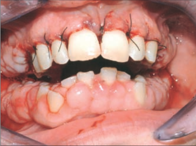
3 ábra. Az első szextáns sebészi korrekciója