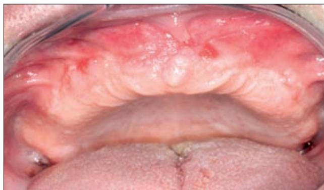
5d ábra. A gyógyult felső állcsont

talmas szövetszaporulat (5a ábra), amely miatt száját már nem is tudta becsukni. Elmondása szerint ezzel az állapottal már több éve élt együtt, de felesége halálát