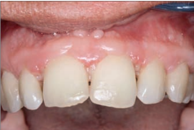
4a ábra. Felső front régió a sebészi kezelés után 1 hónappal

(amoxicillin 500 mg + klavulánsav 125 mg)(Augmentin 675 mg, GlaxoSmithKline, Brentford, Egyesült Királyság). Betegünk motivációja és otthoni szájhigiénéje példás volt, minden alkalommal zavartalan sebgyógyulást és az ínykontúr gyors helyreállítását tapasztal-