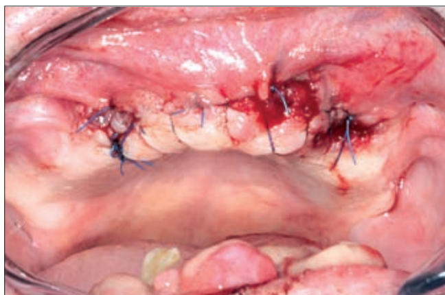
5c ábra. Felső állcsont, sebzés és reménytelen prognózisú fogak eltávolítása után

talmas szövetszaporulat (5a ábra), amely miatt száját már nem is tudta becsukni. Elmondása szerint ezzel az állapottal már több éve élt együtt, de felesége halálát