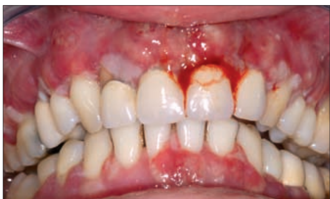
6e ábra. Azonban néhány nap múlva ismét inyduzzanat alakult ki, melyet jelentős fájdalom kísért.

sza, hogy annak enyhítésére napi 6–8 fájdalomcsillapítót (Diclofenac Duo, Pharmavit, Veresegyház, Magyarország) (Cataflam) szedett. Az újabb hisztológiai lelet ismételten nem specifikus pyogen granulomát igazolt.