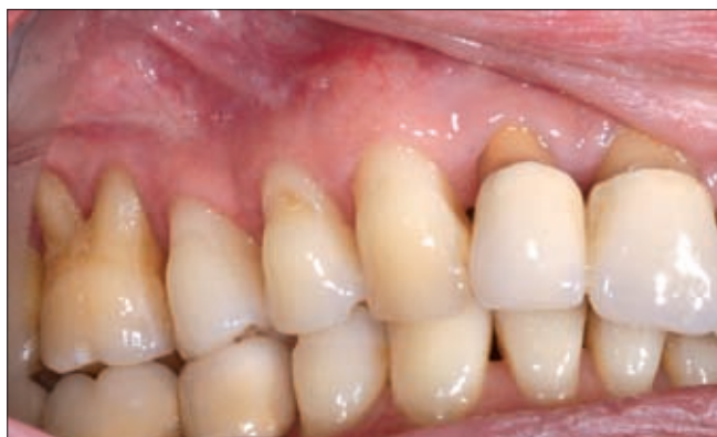
7a ábra. Kortikoszteroid terápiát követő jelentős javulás.

Ekkor, három héttel az utolsó műtét után, hematológussal történt konzultációt követően, szisztémás korti-