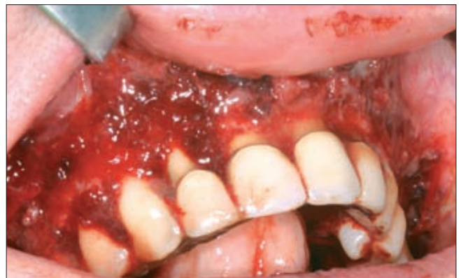
6c ábra. A felső állcsont intraoperatív képe, hagyományos gingivectomia történt.

Itt néhány napos előkészítés után, az akkor már mind a két állcsontot elborító, spontán vérző szövetszaporulatot altatásban, hagyományos gingivectomiával a periosteum szintjéig eltávolítottuk (6c ábra).