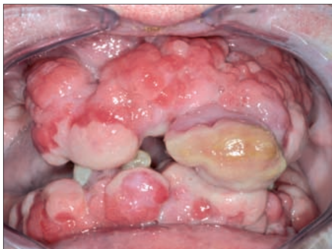
5b ábra. Kalciumcsatorna blokkoló okozta extrém ínnyuherplázia