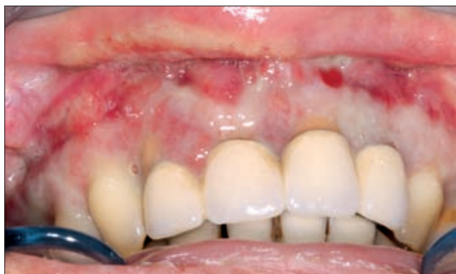
6d ábra. Műtét után először megnyugtató sebgyógyulás zajlott.

A műtét után az első napokban megnyugtató sebgyógyulás zajlott, így páciensünkent hazabocsátottuk (6d ábra). Néhány nap múlva azonban betegünk újabb inyduzzanattal és olyan mértékű fájdalommal tért visz-