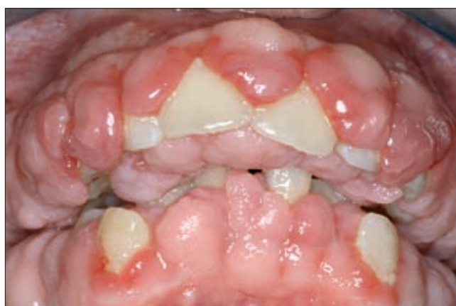
2a ábra. Kiindulási státusz, jól látható az extrém mértékű ínyhiperplázia