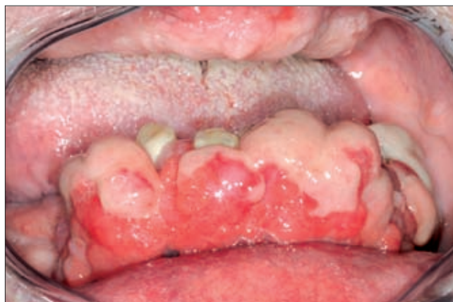
5e ábra. Alsó állcsont a mütét előtt, a fogak szinte ki sem látszanak az ínnyuherplázia miatt