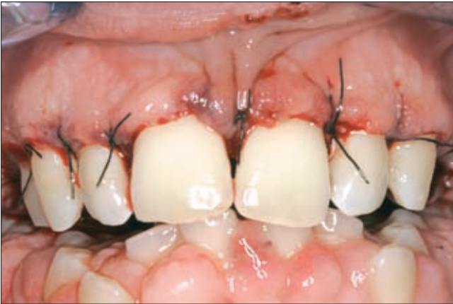
3a ábra. Az ínytöbbletet belső fordított ferde metszéssel távolítottuk el, interdentalisan matracöltéseket alkalmaztunk.