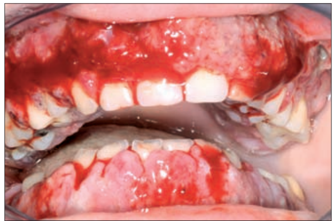
6b ábra. 1 hét után a páciens állapota romlott, spontán ínnyvérzések mellett erős fájdalomra is panaszkodott.