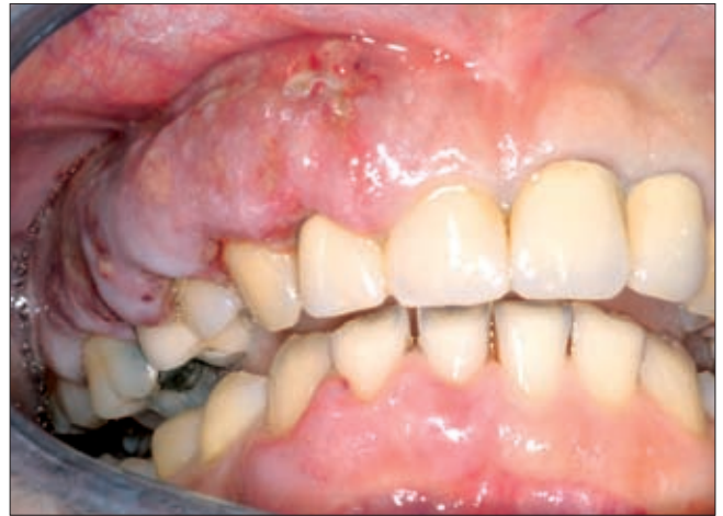
6a ábra. A 41 éves nőbeteg kiindulási státusza.

ny ősünnepek után páciensünk olyan mértékű ínnyduzzanattal, és még fokozottabb fájdalommal tért vissza, hogy a SE Arc- Állcsont- Szájsebészeti és Fogászati Klinika fekvőbeteg osztályára kértük felvételét (6b ábra).