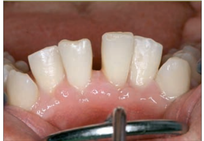
4b ábra. Alsó frontrégió, a páciens otthoni plakk-kontrollja kiváló

Fél évvel az utolsó műtét után a gingiva állapota már kielégítő volt, az ínykontúr közel ideális volt, még csupán kisebb plasztikai korrekciókra lett volna szükség, amikor betegünk a 32. életévében hasi aneurizma ruptúra következtében hirtelen meghalt. A műtétsorozat