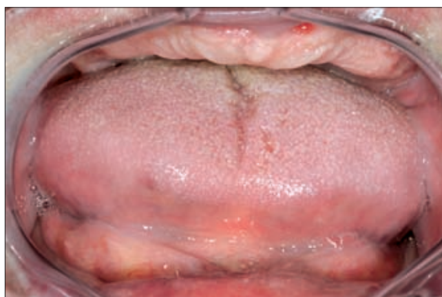
5f ábra. 1 hónappal a mütét után.

követő depressziós állapota miatt nem törődött magával. Intraorális vizsgálat során mind az alsó, mind a felső fogakat extrém méretű, porckemény ínyszövet fedte, a fogak sehol nem látszottak ki. Az OP felvétel szerint a maxillában négy, a mandibulában öt reménytelen prognózisú, jelentős tapadásvesztéset mutató fog húzódtott meg az ínnyuherplázia alatt (5b ábra).