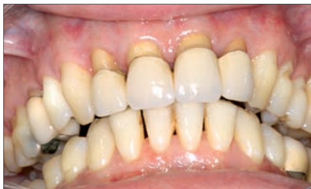
7b ábra. Az íny állapota rohamosan javult, a páciens fájdalmai megszűntek.

koszteroid kezelés mellett döntöttünk. A terápiát 64 mg Medrol®-al (Medrol, Pfizer) kezdtük, amelyet két nap múlva a hematológus kolléga 32 mg-ra csökkentett. A szteroid kezelés 5. napján az íny állapota rohamosan