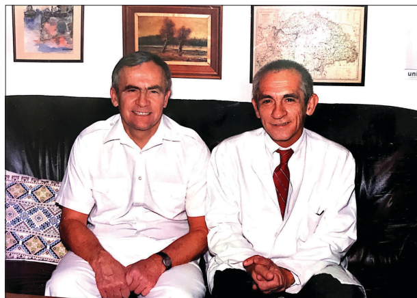
1998. Budapesten, Virág professzor egyik előadása után.

Professzor Emeritus Szájsebészeti Társaság Elnöke