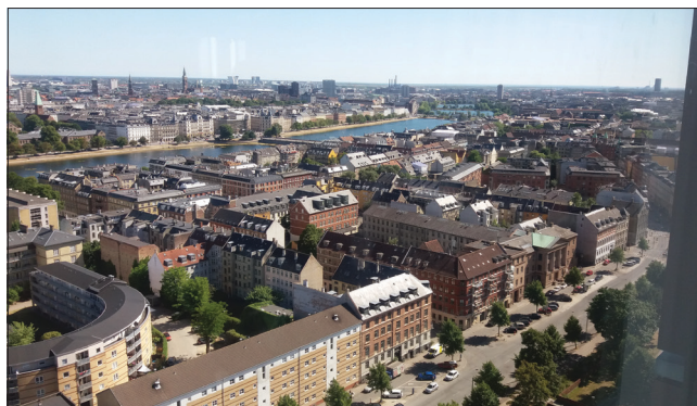
3. kép: Kilátás Koppenhágára a Maersk Tower-ből

A konferencián összesen 168 poszter-előadás szerepelt. A szóbeli prezentáció előtt elegendő idő állt rendelkezésre szekciónként a poszterek megtekintésére, és arra, hogy a felmerülő kérdéseket a poszternél álló szerző megválaszolja. Vitára az előadás után is biztosítottak időt, és ezt a hallgatóság ki is használta. A következő szekciók kerültek sorra: mikrobiológia, kemény szövetek, epidemiológia, klinikai tanulmányok, diagnosztika, de- és remineralizáció és fluorid.