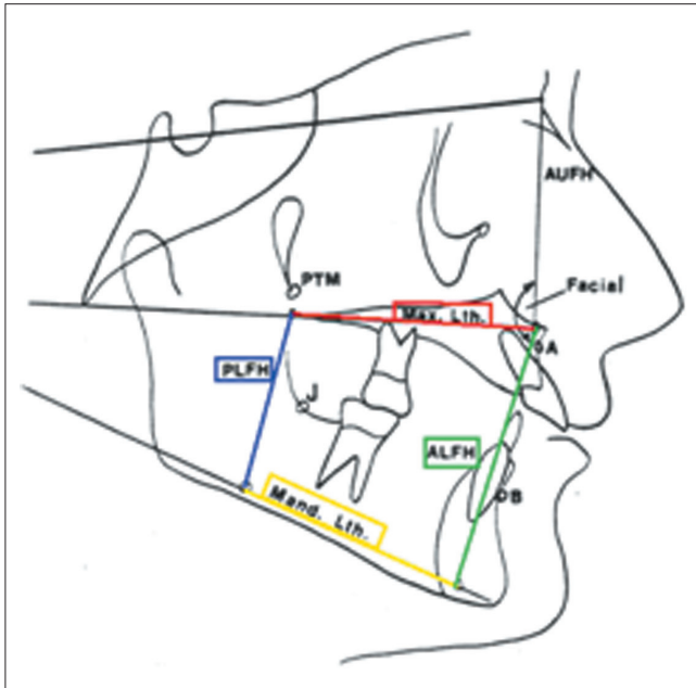
1. ábra: Quadrilaterális analízis: a maxilláris alveoláris csontív-vetület hossza; a mandibuláris alveoláris csontív-vetület hossza; anterior lower facial height [elülső alsó arcmagasság, ALFH]; posterior lower facial height [hátsó alsó arcmagasság, PLFH]