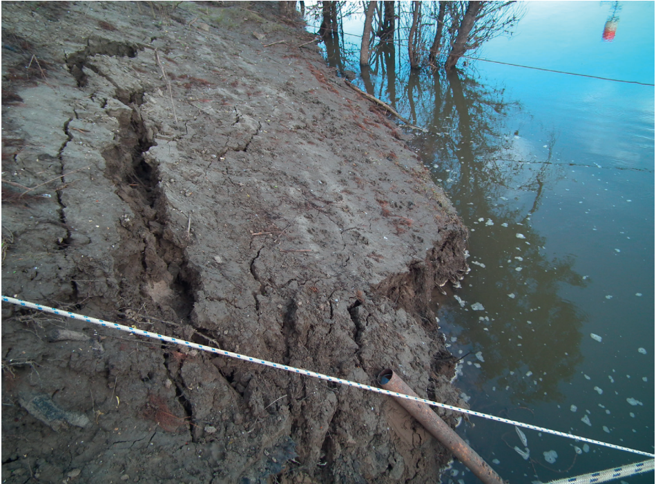
3. kép Közvetlen csuszamlás előtti időszak kinyíló karéjos repedésekkel és a kőzetrepedésekből kihabzó vízzel

Picture 3 Arcuate fractures and foam from cracks immediately before the landslide is triggered