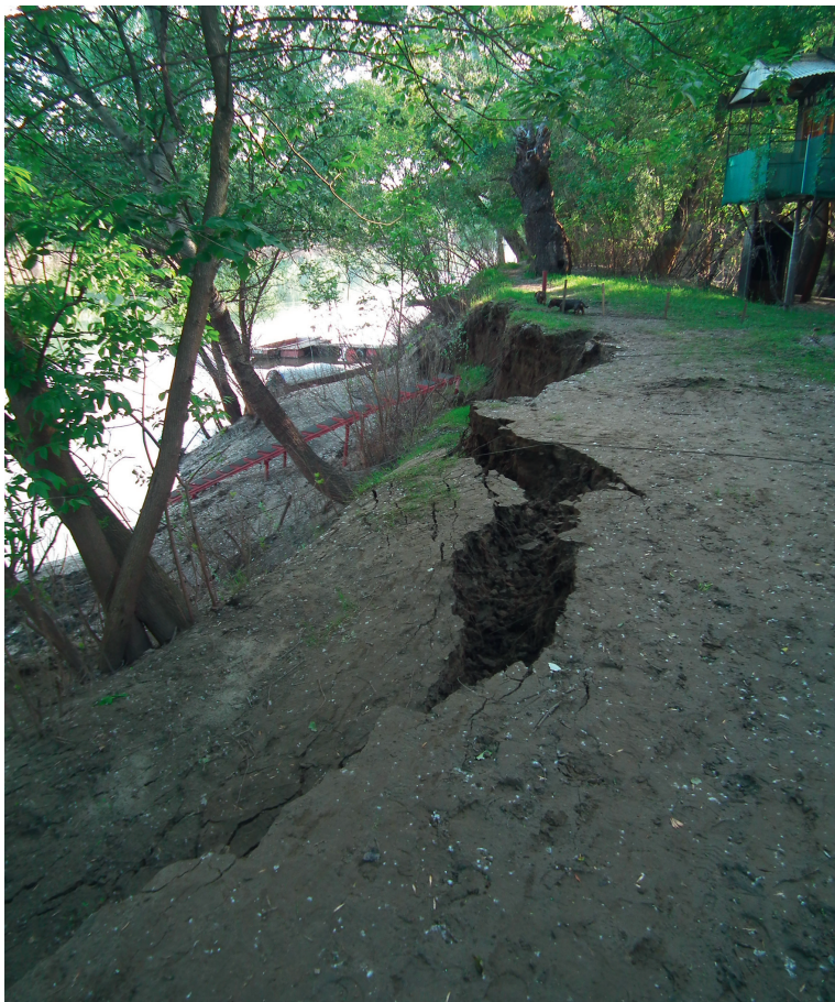
4. kép A partszakasszal párhuzamos, a növények gyökerei mentén előrejelzett repedések Picture 4 Cracks parallel with the bank performed by tree roots