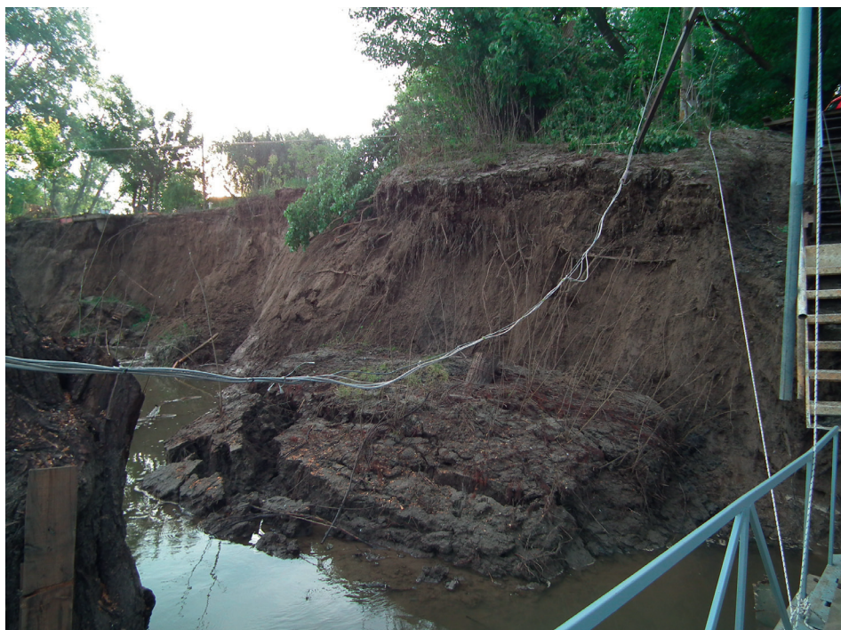
6. kép Csuszamlásos partfal (2013) a mindszenti Halászcserda mellett

Jellemző BEHI-I értékek: A part magassága/ nagyvízi meder mélysége \approx 1,0-1,1 ; A parti növényzet gyökerezési mélysége / a part magassága: 0,29-0,15 ; A gyökérszűrűsége \approx 29-15 ; A partfal lejtőszöge \approx 61-80 ; A part védettsége \approx 100-80 ; Összesen = 17-22,6 ; A part anyaga \approx 5 (lössös anyag); Rétegezettség \approx 10 ; BEHI pont = 42,5 (nagyon magas)