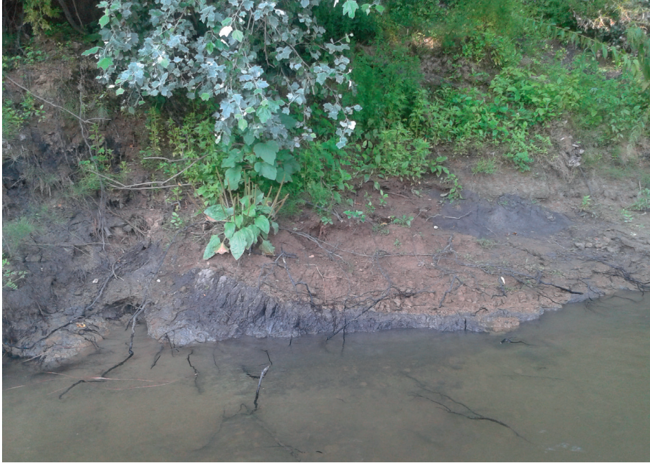
2. kép A folyóvízi üledékek alatti kékagyag a fluvialis üledékképződés előtti tavi és mocsári környezetet jelöl

A tiszai ártér löszös üledékei alatt a vizsgált területen mindenütt megtalálhatók a kék-agyag-szintek, amelyek egykori tavi, mocsári üledékképződési környezeteket jeleznek. Ezek rétegei enyhén dőlnek a folyó felé (2. kép). A talajvíztükör a csuszamlások teljes időtartama alatt lejtett a folyó felé. Tapasztható volt, hogy a csúszással kimozdított tömbökből még két hét múlva is csöpögött a víz. A csúszópályák menti elmozdulás tehát terepi megfigyeléssel is jól bizonyítható volt.