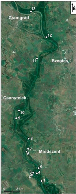
1. ábra A vizsgált partszakaszok helyei az Alsó-Tisza vidéken (alap: Google Earth) Figure 1 Locations of bank sections studied along the Lower Tisza River (base map: Google Earth)

„miocén domborzatfordulat” óta süllyed. A késő miocénre jellemző „nyugodt” süllyedést az Alföldön és a Kisalföldön felgyorsult süllyedés követte (HORVÁTH F.–CLOETHING S. 1996). A vertikális mozgások sebessége mindenütt kisebb, mint 5 mm/év (HORVÁTH F. et al. 2006), Jó I. (1992) szerint 1-2 mm/év (2. ábra).