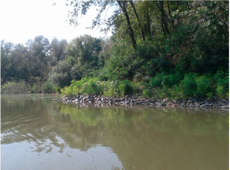
5. kép Partbiztosítás a csanyteleki kanyarulat ÉK-i részén Picture 5 Bank enforcement in the NE of the Csanytelek meander

mértékű lehet a partpusztulás. (A vizsgált partszakaszok közül a 13. sz. tartozik új Tisza-mederhez, a csongrádi hídtól É-ra, a csongrádi Holt-Tiszával szemben).