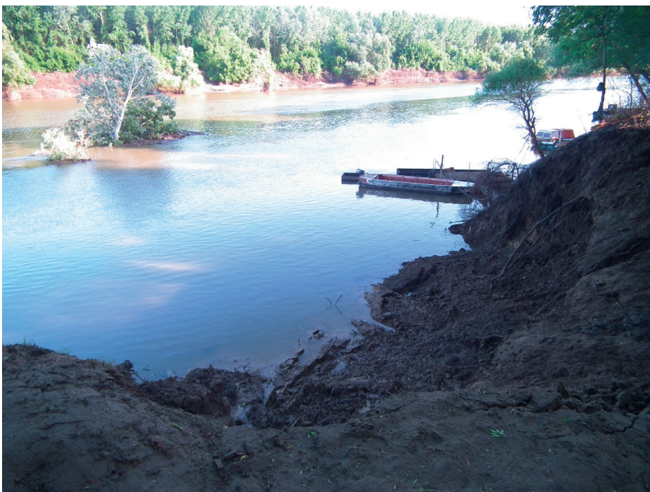
1. kép Karéjos csuszamlás a mindszenti Nagyrév É- i részén Picture 1 Arcuate landslide N of the Mindszent Nagyrév

Közvetlenség és –szerkezeti probléma, hogy a mozgások csúszólap mentén zajlanak-e le, vagy a nyírófeszültség nagyjából egyenletesen oszlik el a parti sáv köztömegében.