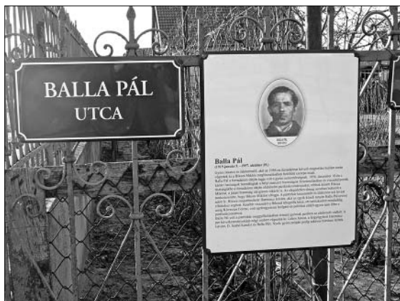
Balla Pál utcanévtáblája Dabas-Gyónon