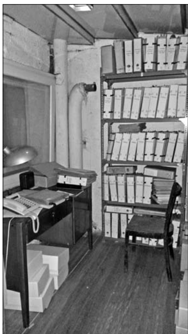
A Magyar Rádió irattárának történeti dokumentumai a bunkerépületben 2014-ben

A '90-es években az atombunker stúdióiba a Magyar Rádió Dokumentációs Igazgatósága, később Archívuma által összegyűjtött történeti iratgyűjteményeiket helyezték el. Ide kerültek a Telephírmondó, az MTI és társvállalatai (Magyar Távirati Iroda, Magyar Telephírmondó Rt., Magyar Hirdető Iroda, Magyar Film Iroda Rt., Magyar Országos Tudósító Rt., Órakoápon, Magyar Gazdasági Bank Rt), a Magyar Központi Híradó Rt., a Magyar Rádióhivatal, a Magyar Rádió és Televízió ügyviteli dokumentumai, a rádiós kollégák hagyatékai és a rádióműsorokban elhangzott hírek szöveágykönyvei az 1939–2007 közötti időszakból. 2016 decemberében az MTVA Archívuma a hírek kivételével minden korábbi elődszervezet iratanyagát átadta a Magyar Nemzeti Levéltár Magyar Országos Levéltárának megórzésre. 73