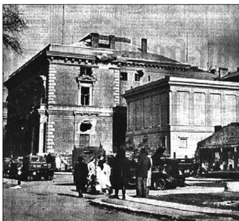
A bunkerépület és az Esterházy-palota 1956-ban (Schweizer Radio Zeitung 1956. november 24. 1.)

A bunker szükségstúdiói alkalmasnak bizonyultak a mentési tervek szerint az alapfunkciói mellett a Magyar Rádió területén lévő muzeális értékek, lemezgyűjtemények, kotta-