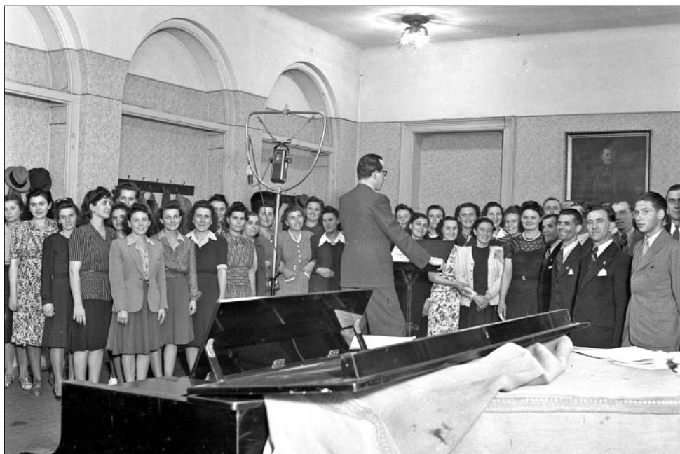
Deák-Bárdos György kórust vezényel a Nemzeti Lovarda dísztermében 1943-ban

A II. világháborús harcokban az épület súlyosan megrongálódott. A Filmhíradók 51 és a Magyar Távirati Iroda archívumában található felvételek szerint az épület 1949 tavaszáig romokban hevert, de létezett. A tulajdonosa az Országos Széchényi Könyvtár volt. 1946-tól a tulajdonosváltást követően a köztársasági palota tulajdonosa, a köztársasági elnöki