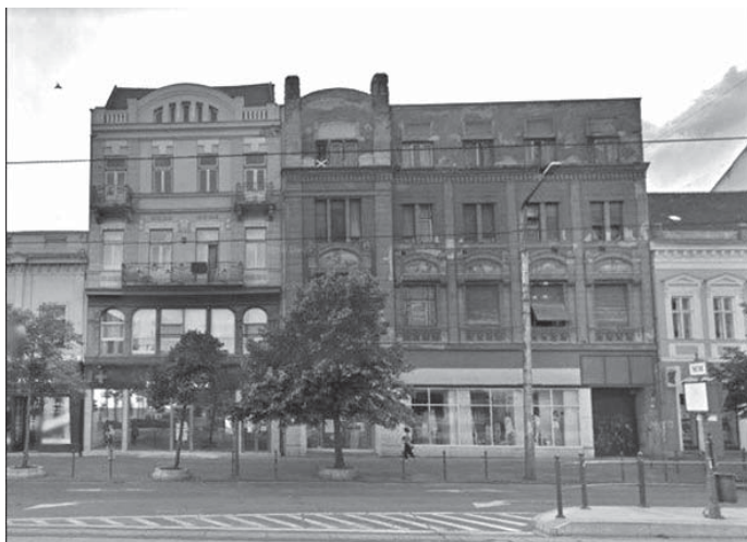
Zoltai Lajos 1904-es rajza a Zápolya – ma Lőrinc pap – utcában álló egykori nádfedeleles házról, illetve a Piac utca 59. és 61. számú emeletes tömbök ugyanebből az időből (DMJV. PH. Főépítészeti Iroda, Építészeti Archívum fotótára. A rajtot a Déri Múzeum őrzi)

ni és/vagy megidézni senki más! Pedig akár az eredetivel megegyező állapotában is megidézhetőek újraépíthetőek lehetnének a papíron és digitális lenyomatban megőrzött, átmentett épületek, de részint még azok is, amelyek egyelőre még állnak. 8