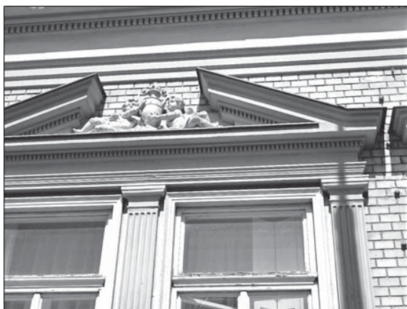
A Bajcsy-Zsilinszky Endre utca 33. számú, díszes zártosú címvis ház