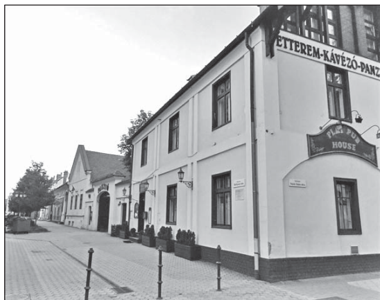
A XVIII. századi és azt megelőző korok jellegét magán viselő Batthyány utca 24. és 26. számú házak

A Rákosi-korban gyakorlatilag megszűnt az a hagyományos lokális kultúra és társadalmi berendezkedés, amely évszázadokon át működött. A folyamat záró időpontja talán 1952-re datálható: ekkor csatolták el ugyanis Debrecentől hortobágyi területeit, végképp megváltoztatva az addigi életmódhoz köthető területi egységet is. Ennek „köszönhetően” tehát az életmód már csak töredékeiben őrizhetett meg valamit a cívisek egykori világából.