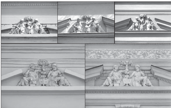
A Rákóczi utca 21., 65., a Bajcsy-Zsilinszky Endre utca 51., a Darabos utca 52. és a Garai utca 28. számú ingatlanok stukkói (A szerző felvételei, 2021)

65., a Garai utca 28. számú házat – amelyek közül csak az elsőként és az utolsóként említett ingatlanok nem élveznek helyi védeltséget. Tehát három, szinte azonos díszítésű épület is megóvandó értéket képvisel, miközben a legrégebb, rurálisabb képet magukon viselő házak nem, vagy legalábbis mindezen ingatlanállomány, amely még áll, kevésbé jelenik meg műemléki katasztereinkben. Ez pedig azt jelenti, hogy aránytalanságok mutathatók ki a védetté nyilvánításban. Mi lehet az oka? Valószínű éppen a túlradó dekorativitás, hiszen a szépség fogalmát az épületek esetében nagyjából az emberek számára éppen a stukkódíszítettség jelenti.