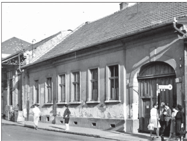
Simonffy Sámuelnek, Debrecen főbírájának lakóháza, a mai Széchenyi utca 10. számú épület, valamint a Széchenyi utca 4. számú lelkészlak (DMJV. PH. Főépítészeti Iroda, Építészeti Archívum fotótára, az OMF vizsgálata, 1951, 1962)