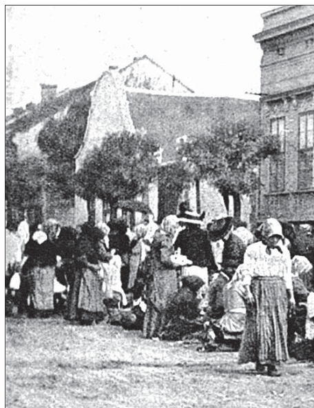
A Rákóczi utca 13. számú archaikus, fésűfogas telekelrendezésű basacívis, avagy nagygazda ház 1920-ban (A. W. Cutler felvétele, Hamilton, F. H. (ed.): Hungary. In Peoples of All Nations. Vol 4. Logos, Press 1920. [2633–2668.] 2669.)

Gondot jelent azonban, hogy ezekről az épületekről rendelkezünk a legkevesebb információval, jellemzően papírra vetett tervek nélkül valósultak meg, továbbá úgy újították fel, vagy alakították át azokat, hogy nem, vagy csak szórványosan maradt fent dokumentáció. Ezek a cívisházak a debreceni építészet legtűnékenyebb rétegei, és ha csupán a szűk belvárost nézzük, ez mintegy 90 még fennmaradt házat jelent. Példa erre a XVII–XVIII. századi vagy talán még ennél is régebbi elemeket magában foglaló, egykor íves, barokk oromzatos, Rákóczi utca 13. számú archaikus cívisház, amely immáron nem áll. Bontása előtt azonban még sikerült felmérni, sőt, az építőanyag jellegzetes elemeiből