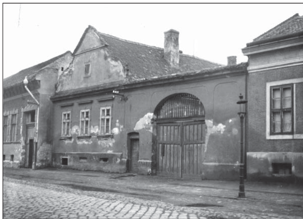
A Bajcsy-Zsilinszky utca 42. számú copf stílusú módos cívisház, az utolsó XVIII. századi íves oromzatú épület a belvárosban

való aktívabb kapcsolat megtörése, amely az addig folytatott életmódra radikális hatással volt. Majd a nagy gazdasági világválság és a II világháború, végezetül pedig a szocializmus, a tervgazdaság, az iparosítás, majd a fogyasztói társadalom begyűrűzése semmisítette meg mindazt, ami a cívís életmód még túlélő szegmense volt.