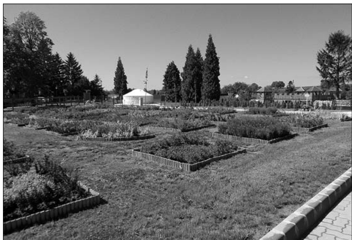
A reneszánsz kert a jurtával és a palánkvárral