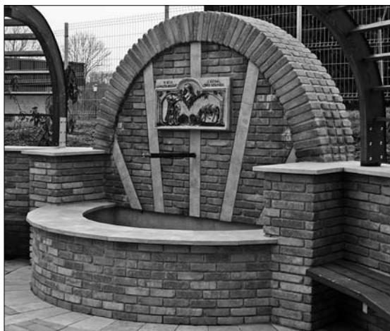
A Máriás-kút

Az Árpád-kori Csurgó johannita rendházának romjai felett élhetjük át a magyar középkort. Királyok fordultak meg e helyen, okleveleket állítottak ki. Török Bálint és a Zrínyiek birtokaként még virágzott, de 1566-ban, Szigetvár után elfoglalta a török. Zrínyi György 1594-ben visszavívta, a torony és a romok beépítésével kis templomot emeltek a Szentlélek tiszteletére. 1600-ban megtört az ellenállás: „Ez a kis magyar oázis is bekerült a török hódoltság nagy tengerébe.” 7