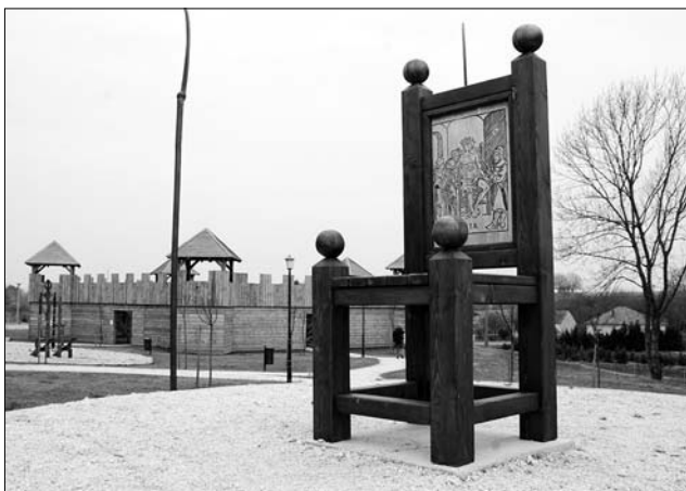
Dózsa trónja és a palánkvár

ország történetének küzdelmes, sok szenvedést megélt szakasza kezdődik, kezdetben Török Bálint és felesége Pemfflinger Katalin idilli házasságával, „Magyarország legszebb virágokertjé”-vel, majd a férj az Egri csillagok ban is megörökített Héttoronyba zárásával, a Török- és a Zrínyi-család viszályával, a fenyegető török veszéllyel. Miközben a török már a szomszédban volt, és a csurgói vár úrnőjének férje raboskodott, Csurgó egy ideig még a béke szigeteként tartotta magát.