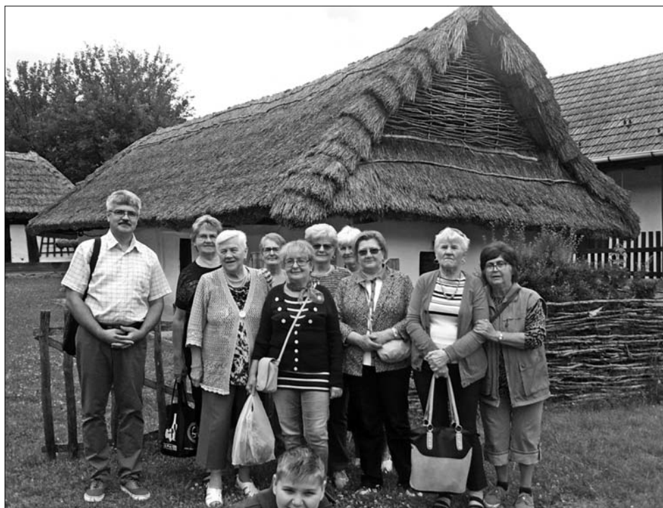
Az egyesület tagjai a Palóc ház előtt

a vidéken. A rendelet eredményeként már nem épültek új faházak, ezért pusztulásukkal az épületállományon belüli arányuk egyre csökkent. Az 1910. évi népszámlálás szerint Heves megyében 0,8% volt a faházak részaránya, ami 374 házat jelentett. 2 Utoljára az 1930-as népszámlálásnál tapasztalhatjuk a csökkenő arányszámot, mert ezt követően már meg sem jelent a népszámlálás adatsorában.