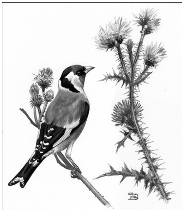
A tengelic (Kókay Szabolcs akvarellje)

Említettem már, hogy körülbelül 16 esztendőös koromig ornitológusnak, vagyis madarakkal foglalkozó tudósnak készültem, de érdeklődésem nem korlátozódott szigorúan a tollas jószágokra, tartottam én akkor piócától és aranyos futrinkától kezdve a házinyúlíig mindenféle élőlényt, amit anyámék megtértek a lakásban, s nagyapám erkélyén elfért. Mert hogy budai bérházban laktam, s természetimádatomat a Gellért-hegy oldalára és a Múzeumra, s a vasúti töltés közti „pusztaságra” voltam kénytelen korlátozni. De azért figyelmem leginkább a madarak felé fordult: tavasszal fészekből kipotytyant verébfiókákat neveltem, a szép emlékü Teleki téri ócskapiacon akkor még bőven kapható énekesmadarokból kenderikéket, zöldikéket, citromsármányokat vásároltam, volt ajándékba kapott szelíd csókám, Balaton-partján talált és fölnevelt töviszúró gébicsem, 4 törött szárnyú, de buzgón éneklő erdei pinyem, hullámos papagájom, kanárimadaram, zebrapinyem, mozambiki csicsörkém – csak ami hirtelen az eszembe jut. S mielőtt még bárki sajnálni kezdené szüleim szegény pénztárcáját, sietek megjegyezni, hogy a tartási költségek jelentős részét a nagyapám erkélyén berendezett fehéregertenység rendszeres szaporulatának a Múzeum körüli tudományegyetem valamelyik tanszéki laboratóriumában való értékesítésével teremtettem elő. Mindezt annak az öt tengelicfóának a kedvéért mondtam el, akiknek oly nagy szerepük volt a madarak iránti vonzalmam történetében.