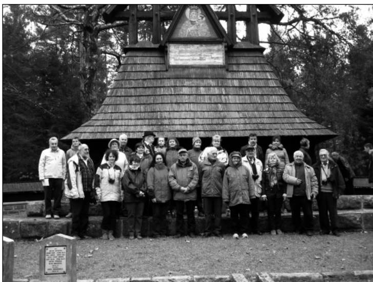
A 2014. évi galíciai emléktúra résztvevői