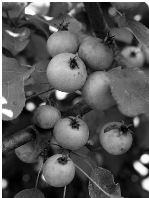
Vadalmafa virága és gyümölcse

Magas csersavtartalmú, fanyar ízű, sárgászöld, a napsütötte oldalon esetleg pirossal árnyalt, kemény húsú termése 2–3,5 cm nagy, többnyire gömbölyded, a nemes almakénál jóval kisebb. Terméskocsányának hossza többnyire megegyezik a termés hosszával. A termésen a kocsánynál és a csészénél alig található bemélyedés van. A termés szeptember-októberben ér, barna magjai gyengén mérgezőek.