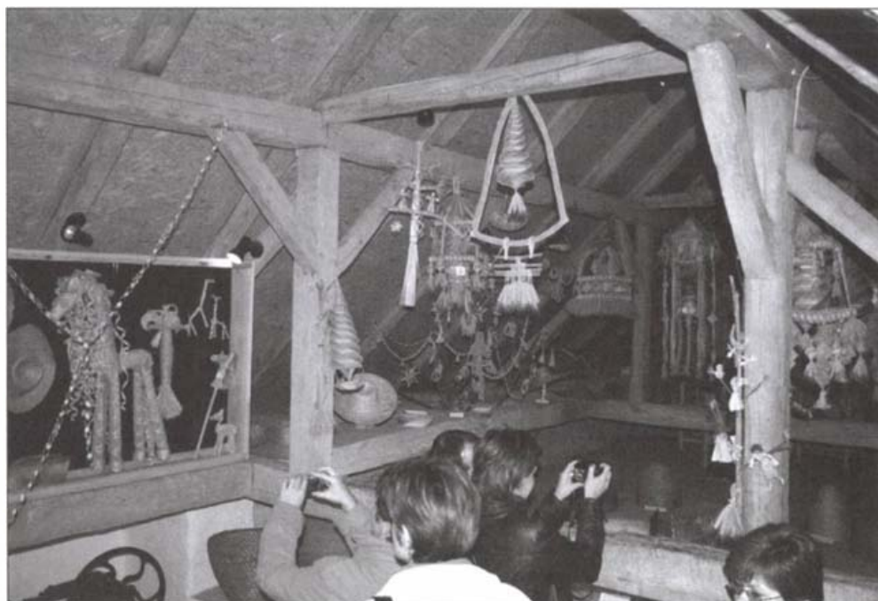
A Szalmalekvár c. 2010. októberi kiállítás részlete

ják be, természetesen a szükséges eszközökkel együtt. A főfal tárlóiban az ünnepekhez kapcsolódó háziáldások, díszített tojások, betlehemek, keresztek, illetve különböző játékok kaptak helyet: ugró béka, malomjáték, babaházak. A muzeális kiállítóhely különleges értéke a wohleni (Svájc) Freiämter Strohmuseumtól kapott XIX. századi kalapesipke mustralapok, melyek lószörre applikált vagy szövött szalmabordűrök vagy nyomott minták. Ezekkel a kínáló lapokkal jártak a házalók városról városra, s vettek föl rendelést a következő évi egyedi kalapra. Az udmurt baba, a huicita indián kalap, a fényt geometriai alakzatokban megtörő lengyel mobil értékes darabjai a gyűjteménynek.