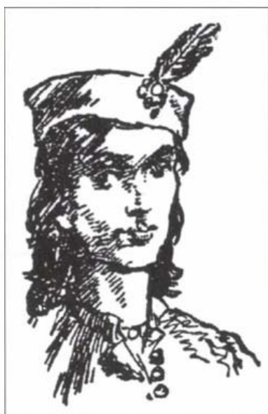
Bornemissza Gergely