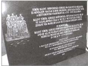
A Yedikule Múzeumban elhelyezett emléktábla

Bornemisszát a török ígéretéssel sem tudta rávenni, hogy renegattá váljon, bár szeretnék volna megnyerni maguknak a kiváló katonát. II. Szulejmán szultán Gergely deákot magával vitte Kis-Ázsiába, a Konstantinápolytól 600 km távol eső Amasiába. Így Bornemissza – akaratán kívül – a korai magyar utazók egyikeként jart ezen a kontinensen. Majd a szultánnal a fővárosba visszatért Bornemisszát 1555. szeptember 22. előtt, pontosan nem tudjuk melyik napon, Kara Ahmed nagyvezír felakasztatta. Istvánffy Miklós történetíró a nagyvezír személyes bosszújának tartotta Bornemissza kivégzését, miután Ahmed nem tudta megbocsátani az Eger vára alatt 1552 őszén elszenvedett kudarcot. Viszont a nagyvezírt is utólerzte rövidesen a végzete, mivel Bornemissza halála után néhány nappal, szeptember 28-án Ahmedet a szultán jóváhagyásával megfojtatták.