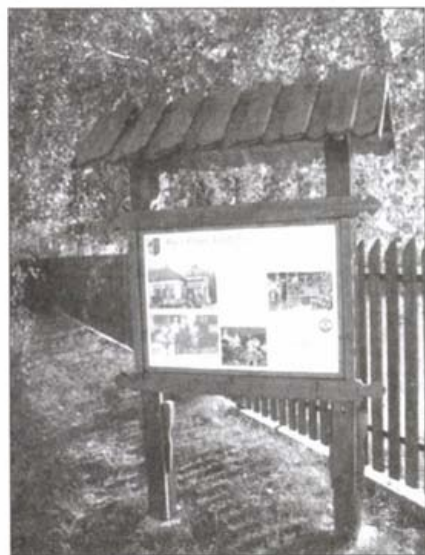
A tanösvény egyik állomáshelye

A község díszei, a Beniczky kastélyok is a XX. században pusztultak el. A turai-szentlászlói út szegletében álló „felső kastélyban” 1849-ben még Paskievics herceg is beszállásolt; valamint itt fogadta jeles irodalmár ismerőseit a ház úrnője, korának híres írónője, Beniczkyne Bajza Lenke. Az „alsó kastélyban” – az Almási út mentén – lakott a család másik ága. Ezt az épületet Lechner Ödön tervei alapján akarták bővíteni, szépiteni, de a háborús évszázad meggátolta a terveket, és a szovjet szükségkórház kiköltözése után a kastély az „építőanyag-igény” áldozata lett. Egykori gondozott parkja helyén új falurész épült, és csupán a bejárat kövhídjának egy része maradt meg – a közkedvelt dallal: „A zsámboki dobogós kövhídnál...” A község harmadik „úrilaka”, Bíró Zsigmond kastélya szerencsére túlélte a háborút, és ma a József Attila Művelődési Ház működik benne. Ennek a kertjében egy nagy szabadi-dős parkot is kialakítottak. Itt az udvaron tartják évente a híres „Lecsót a keceléből” nevű kétnapos fesztivált, amelynek során a lecsófőzés mellett terménybemutatók, honismereti rendezvények, templomi hangversenyek, a helyi és a környékbeli népi együttesek fellépései színesítik a programot.