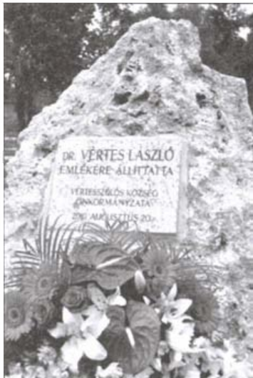
A 2010-ben felállított Vértés László emléktábla

2010. augusztus 20.: A hagyományosan jó hangulatú, programokban gazdag nap a bemutatóhely köré szerveződött. Az önkormányzat Vértés Lászlónak posztumusz Vértesszőlős diszpolgára címet adományozott. Az erről szóló okirat átadására augusztus 20-án került sor, átvételére megkeresték és meghívták Vértés László Izraelben élő fiát, ifj. Vértés Lászlót, aki nagy örömmel érkezett meg egyik lányával. A közös ebéden és az ünnepségsorozaton alkalma volt találkozni azokkal a régi kollegákkal, akik közül néhányan – sajnós, már elenyészően kevesen – még személyesen ismerték idősebb Vértés Lászlót, vagy az ő munkatársai voltak a Nemzeti Múzeumban és a Földtani Intézetben. Az önkormányzatnál a vendégeket megajándékozták Vértés Lászlónak a könyvforgalomból régóta hiányzó munkája, a Kavics ösvény reprint kiadásával. 3 Az anyagi keretet LEADER pályázat biztosította. A könyv az ásatások és a kutatáshoz, a lelőhely anyagának feldolgozásához kapcsolódó külföldi utak krónikája Vértés László ironikus, szórakoztató, ám hiteles megfogalmazásában.