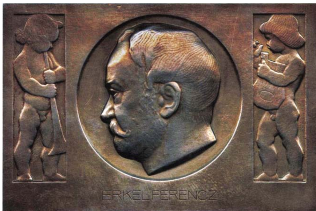
Erkel-plakett. Berán Lajos alkotása, 1912. (Magyar Nemzeti Múzeum Éremtár)