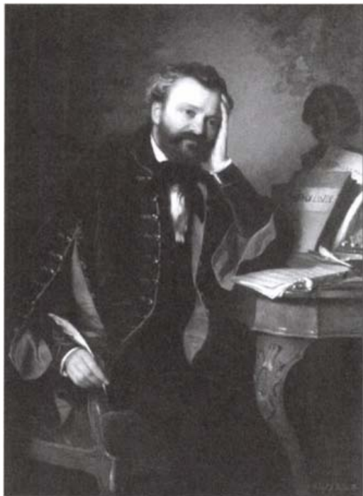
Erkel Ferenc. Györgyi (Giergl) Alajos olajfestménye, Buda, 1855. (Magyar Nemzeti Múzeum Történelmi Képcsarnok)

Az ezekben az években a múzeum közelében, a Magyar utca 1-ben lakó Erkel minden bizonnyal nemcsak saját koncertjeire járt a Nemzeti Múzeumba, hanem másokéin is megfordulhatott, mint hallgató. Az egyik fennmaradt múzeumi (könyvtári) vendégkönyv tanúsága szerint Erkel Ferenc ott volt, amikor barátja és pályatársa, Liszt Ferenc az „Esztergomi mise” nyilvános próbáját tartotta (vezényelte) a múzeum dísztermében, 1856 augusztusában. 20