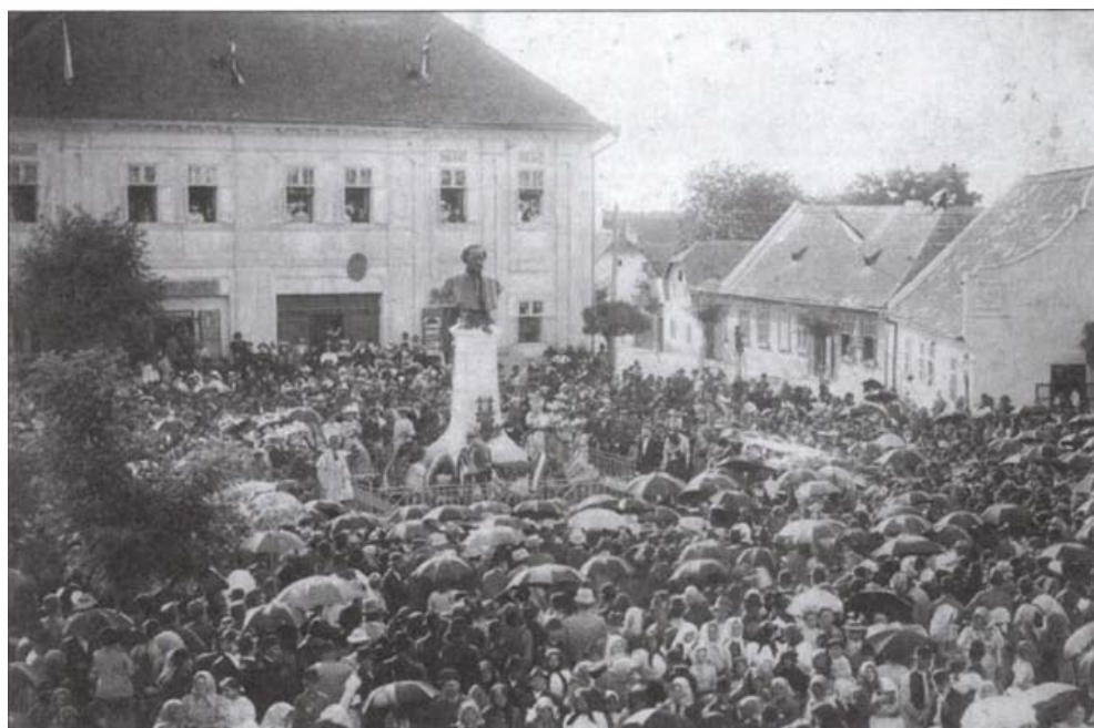
Békés Gyula fényképész felvétele az Erkel-szobor avatásáról, 1896

(A fotók lelőhelye: Békés Megyei Múzeumok Igazgatósága Erkel Ferenc Múzeuma, Gyula)