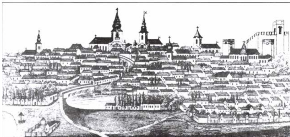
Céhes levélpapír Gyula látképével az 1840-es évekből

További fejlődéséhez el kellett hagynia szülővárosát. Az édesapja 1822-ben Pozsonyba, a bencések gimnáziumának II. osztályába íratta be. Pozsony ebben az időben vált az ország zenei életének központjává. Itt minden mester megfordult, aki valamit is számított: 1823-ban Liszt zongorajátékát hallgathatta, s többször is megcsodálhatta Bihari János hegedűvirtuóz muzsikálását. A század elején bontakozott ki az új magyar zenei köznyelv, melyet verbunkos nak mondanak. Hihetetlenül gyorsan terjedt el és példátlan hatást gyakorolt mindenkire. Erkel első valódi mestere Klein Henrik (1756–1832), a kiváló karnagy és pedagógus volt, aki a bécsi klasszikusok bűvöletében élt. Édesapját is ő tanította, s ő írta az első kritikát a 9 éves Liszt művészetéről is.