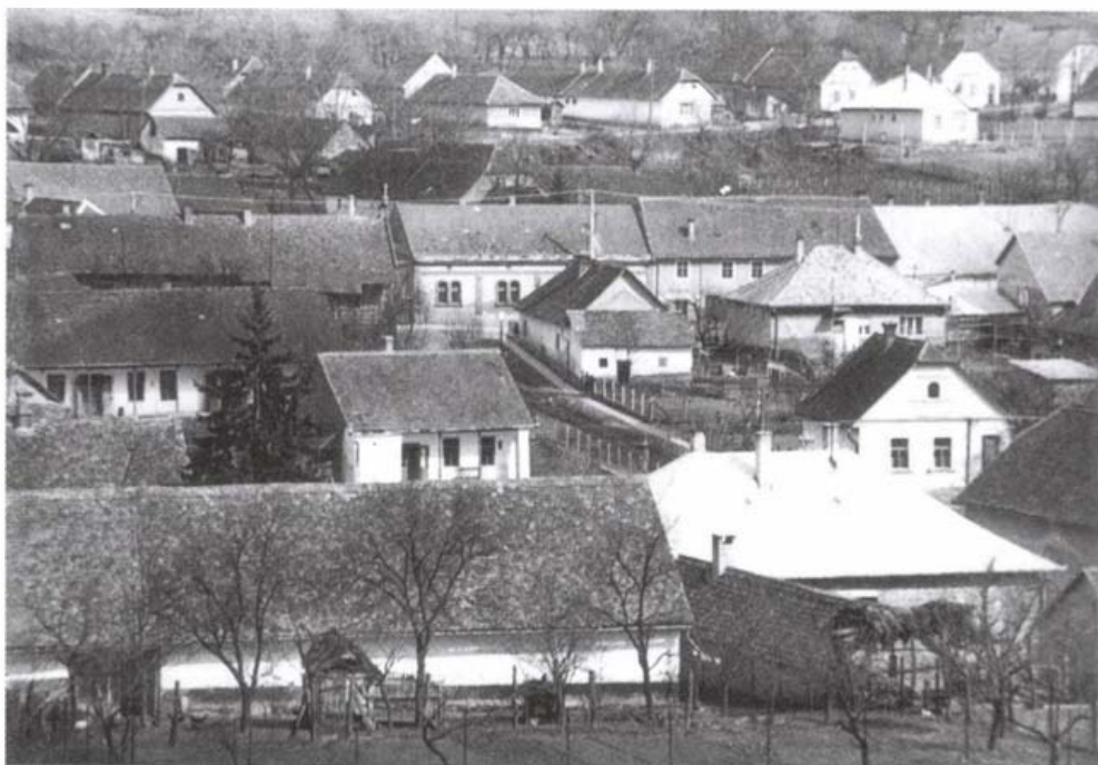
Teveli látkép az 1980-as évekből